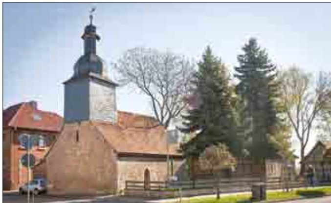
Das ehemalige Hospital St. Andreas in Großengottern

„Dank des Geldes können wir einen Teil der dringend notwendigen Sicherungsmaßnahmen an beiden Denkmalobjekten durchführen. Im vergangenen Jahr wurde beispielsweise mit der Dachsanierung der Schlotheimer Windmühle sowie der Sicherung der Fachwerkkonstruktion an einem Nebengebäude des Hospitals St. Andreas begonnen. Beide denkmalgeschützten Gebäude können als extreme Problemfälle in Sachen Erhaltung gesehen werden. Die Gemeinde Schlotheim beziehungsweise der Förderverein Spittel Großengottern e.V. können die Kosten dafür nicht aufbringen. Der Eigenanteil, der für die Zuweisung der Fördermittel unerlässlich ist, konnte glücklicherweise aus Spendenmitteln finanziert werden“, so Ines Gliemann, die im Landratsamt, im Fachdienst Bau und Umwelt für den Denkmalschutz zuständig ist.