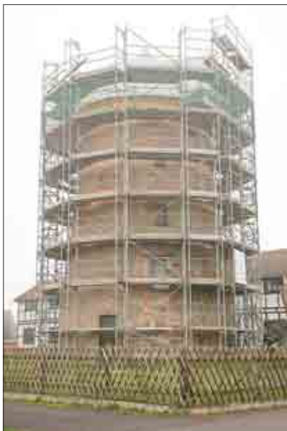
Die eingerüstete Windmühle in Schlotheim

Gleich zwei Objekte im Unstrut-Hainich-Kreis gehören zu den 22 Förderprojekten der Deutschen Stiftung Denkmalschutz in Thüringen. Sowohl die historische Windmühle in Schlotheim als auch das Spittel in Großengottern erhalten 2015 Fördermittel in Höhe von je 20.000 Euro. Bereits im vergangenen Jahr fanden beide extrem auffälligen Objekte Berücksichtigung bei der Stiftung und wurden mit je 25.000 Euro unterstützt.