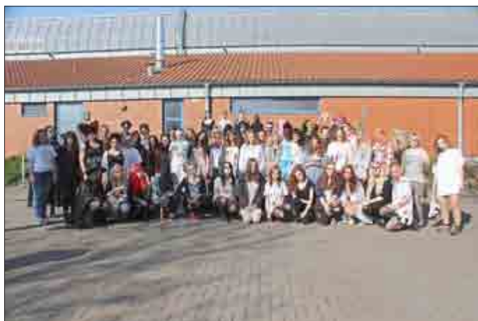
Tag 5: Horror