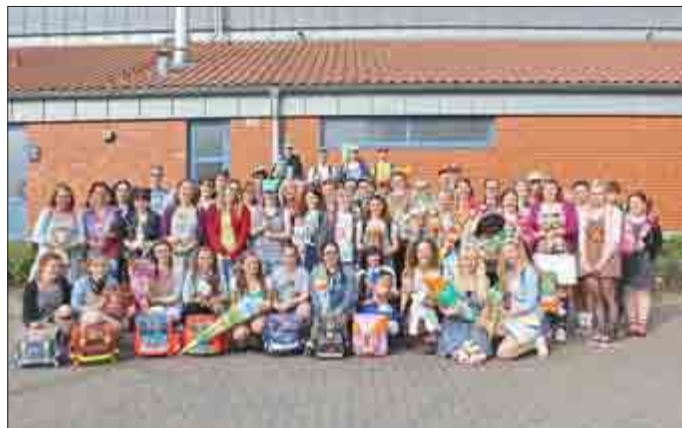
Tag 1: Erster Schultag