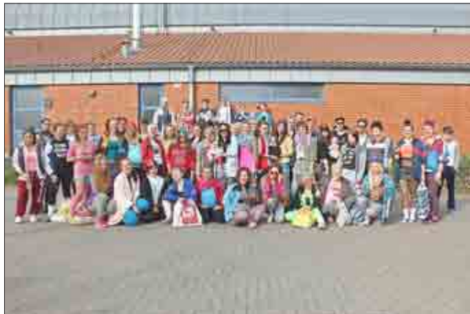
Tag 2: Assitag