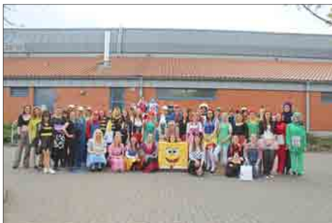
Tag 4: Helden der Kindheit