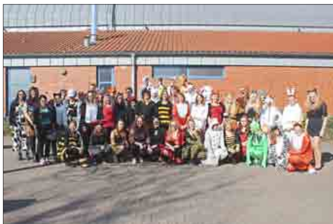
Tag 3: Tiere