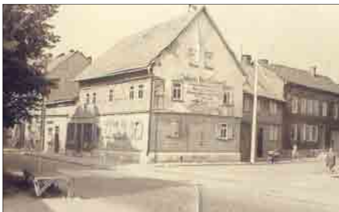
Milchbock stand vor dem Haus Heyer/Haßkerl, Goethestraße