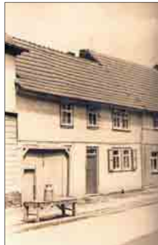
Milchbock stand 1950 vor dem Haus Elly Voigt, Obere Kirchstraße 16 (jetzt Martina Tröstrum).