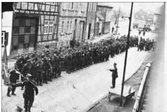
Januar 1960 - bewaffneter Aufmarsch der Kampfgruppen in der Marktstraße, der Kampfgruppenleiter steht vor dem Milchbock