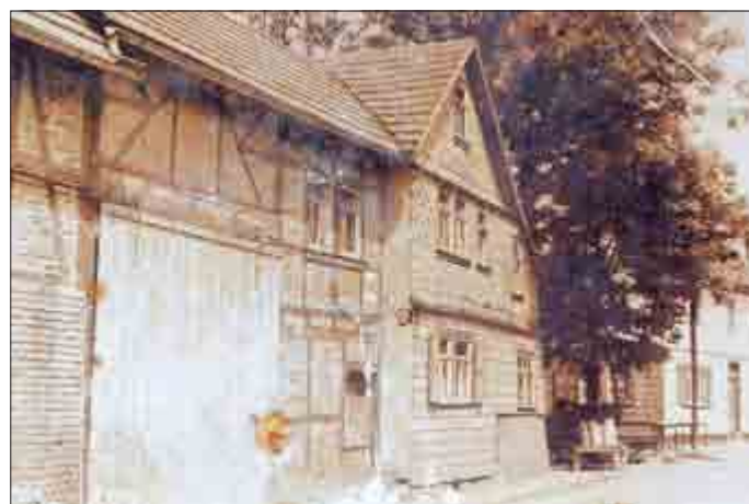
1951 - Milchbock stand am Haus Knoedel, Untere Kirchstraße 9

In der Molkereigenossenschaft in Schönstedt wurden die Kannen abgelenkt, mit einem Teil Magermilch oder Molke gefüllt und wieder aufgeladen. Auf dem Deckel der Milchkanne und seitlich war die Nummer in schwarzer oder weißer Ölfarbe erkenntlich. Die Nummerierung der Kannen konnte nach Anmeldung der Milchlieferanten bei der Molkerei dort vorgenommen werden.