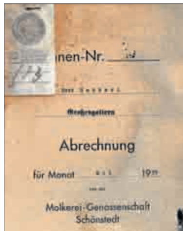
Monatsabrechnung von der Molkerei-Genossenschaft Schönstedt