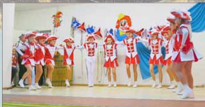
Kindergarde ACV Altengottern