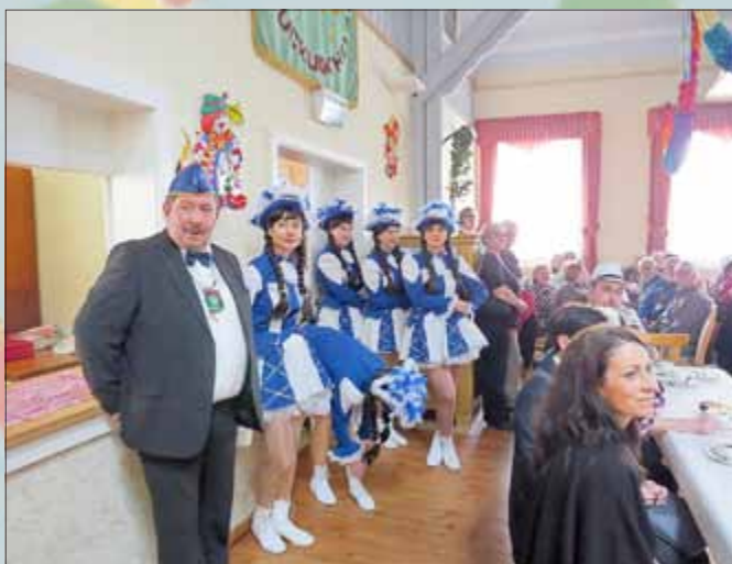
Heroldishäuser Garde kurz vor ihrem Auftritt