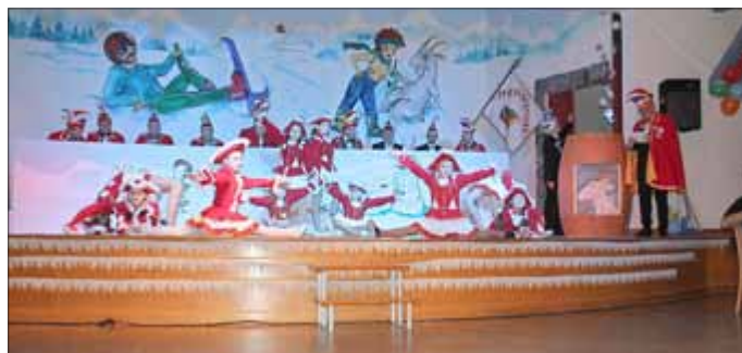
Gardetanz der „Lollipops“