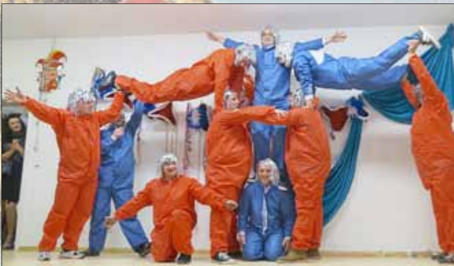
Männerballett VCCM Mülverstedt