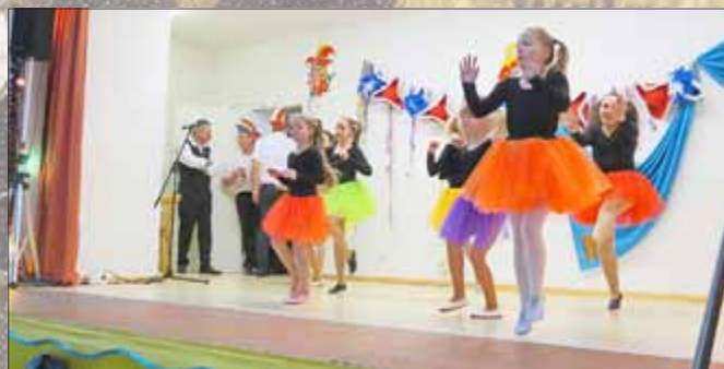
Die „Lollipops“ v. Faschingsverein „St. Bock“ Großengottern