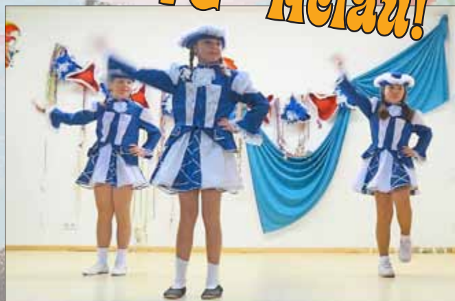
Kindergarde HCC Heroldishausen