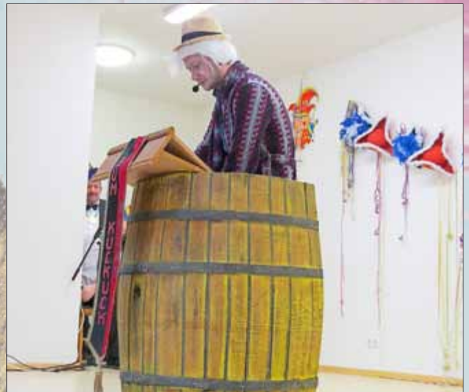
Rentnerbütt v. Florian Meyer HCC Heroldishausen

Neben den tollen Gardetänzen der Altengotterischen und Heroldishäuser Balletts erfreuten ebenso die spritzigen Tänze der Kinderformationen, wie die Kinderprinzengarden aus Altengottern und Heroldishausen und die „Lollipos“ aus Großengottern und das verrückte Mülverstedter Männerballett. Sie alle wurden mit viel Beifall belohnt. Die Rentnerbütt, Dick & Doofs Auftritt, und der Sketch „Aber schön muss sein“ attackierten die Lachmuskeln der Senioren gewaltig. Das abwechslungsreiche Programm kam beim Publikum sehr gut an und der gelungene Senioren-Nachmittag mit viel Spaß und guter Laune ging wie immer viel zu schnell vorbei. Verabschiedet wurde sich mit den Worten: „Bis nächstes Jahr in Mülverstedt“, denn 2018 feiert der VCCM Mülverstedt sein 30-jähriges Jubiläum.