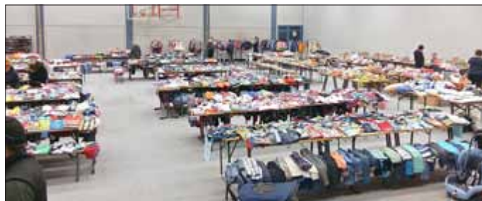
Freitagabend - die Halle ist eingeräumt