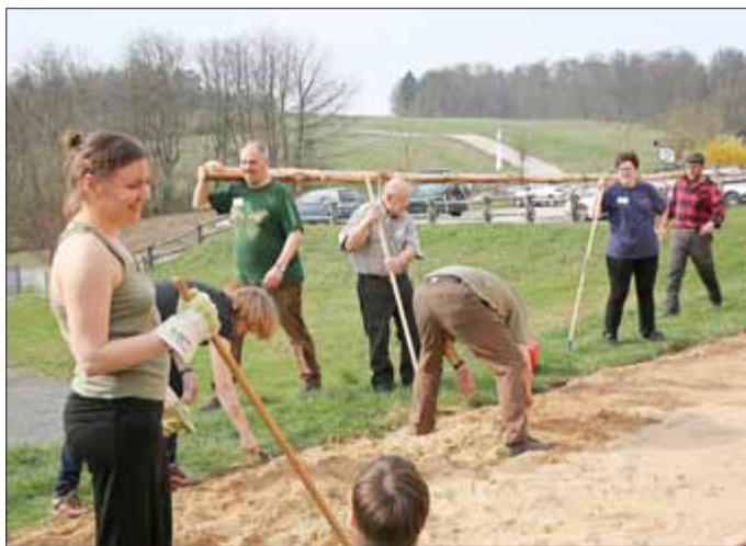
Nicht nur reden, sondern auch anpacken - die Ehrenamtlichen beim Einsatz im Rahmen des Dialogforums.

Das Freiwilligenprogramm „Ehrensache Natur“ gibt es bereits seit 2003. Allein in Thüringen sind jährlich rund 150 Frauen und Männer ehrenamtlich unter dem Dach von „Ehrensache Natur“ aktiv. Das Freiwilligenprogramm wurde 2013 und 2015 als Projekt der UN-Dekade Biologische Vielfalt ausgezeichnet. Zudem wurde es 2013 vom Rat für nachhaltige Entwicklung als „Werkstatt N-Projekt“ ausgezeichnet.