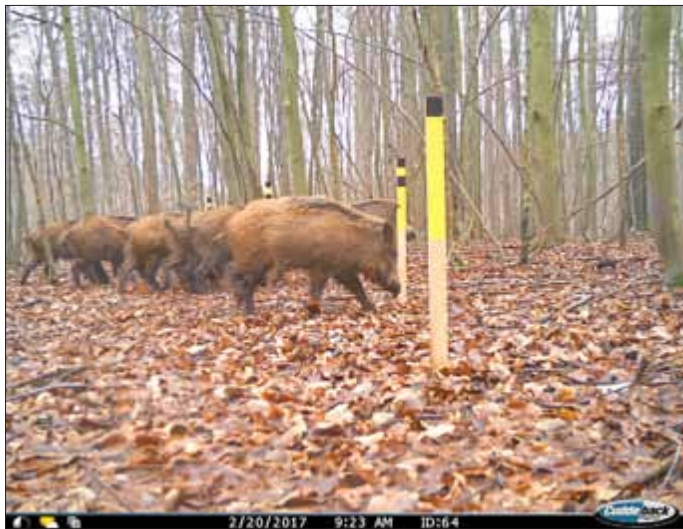
Vorbildlich in Reihe - so lassen sich Wildschweine gut zählen