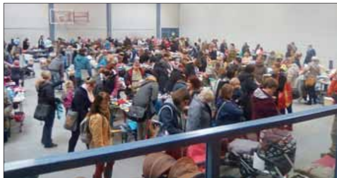
Gewimmel am Samstagvormittag