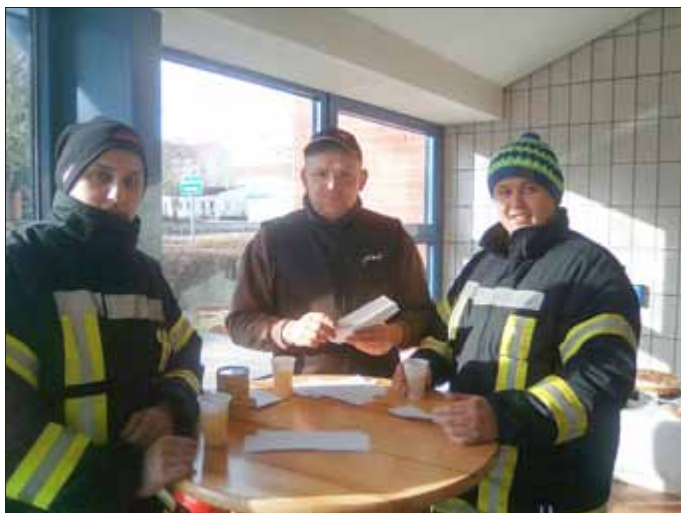
Die Ordner der FFW Großgotttern