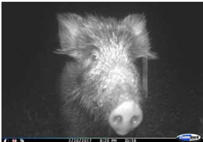
Ein - offensichtlich - neugieriges Wildschwein vor der Wildkamera

Außer dem auffälligen Halsband bekommen die Wildschweine in jedes Ohr eine gelbe Ohrmarke. So können sie später auf Fotos von Wildkameras identifiziert werden, die extra dazu in den letzten Monaten an ausgewählten Standorten im Nationalpark installiert wurden. Mit Hilfe der Bilder soll die Größe des Wildschweinbestandes statistisch abgesichert ermittelt werden.