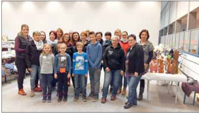
Die Flohmarkt Muddis und einige Helfer