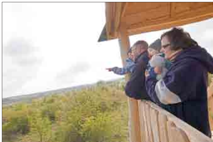
Familie Otto-Albers aus Erfurt genießt die wunderschöne Aussicht vom neu errichteten „Ausguck Schlehenblick“

„Der Ausblick an dieser Stelle ist eindrucksvoll und verdeutlicht, wie sich - im Nationalpark ungestört - der Wald dieses geschundene Fleckchen Erde zurückerobert“, so Nationalparkleiter Manfred Großmann. Bis Mitte der 90er Jahre wurden die 1972 angelegten Schießbahnen militärisch genutzt und durch Schafbeweidung offengehalten. Seit 1998 findet keinerlei Nutzung mehr statt. Nach den Sträuchern wachsen als erste Waldbäume Esche und Ahorn, die dann in einigen Jahrzehnten der Buche Platz machen werden.