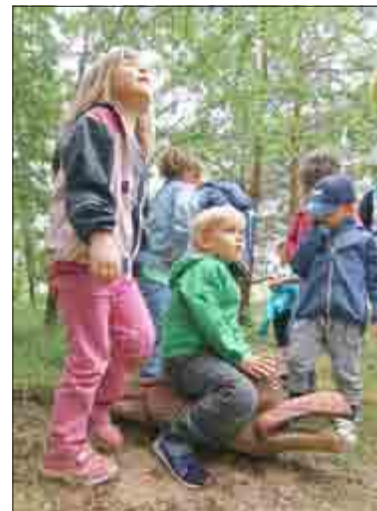
Gefunden und besetzt - die Kinder entdecken die Waldwichtel ganz schnell für sich.