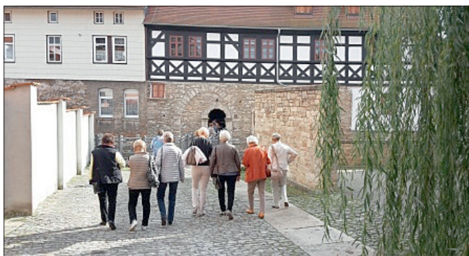
Vor dem Eingang des Apothekenmuseums in Bad Langensalza