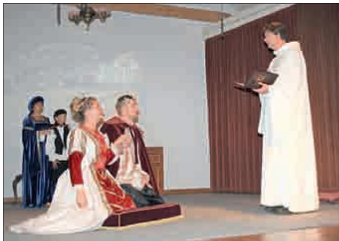
Die niedlichen Kindergartenkinder berührten die Zuschauer mit ihrem Engelstanz.