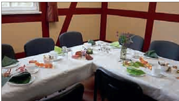
Die herbstlichgeschmückte Kaffeetafel