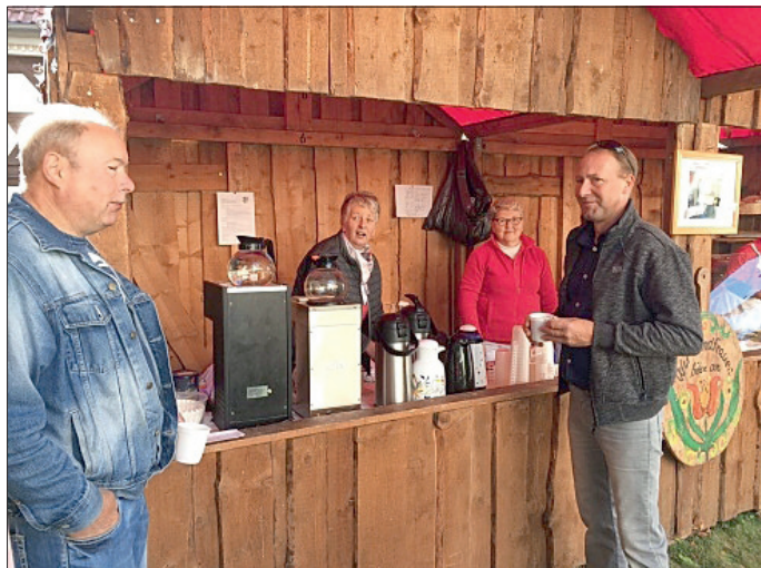
Nette Gespräche vorm Jahrmarktsstand der Landfrauen