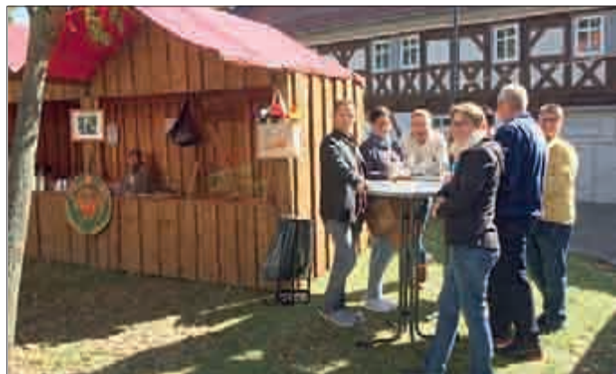
Hatten wir nicht herrliches Jahrmarktsamstagswetter.