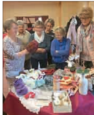
Der Handarbeitsstand wurde von Anfang an belagert.