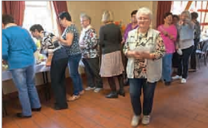
Das Kuchenbuffet wurde eröffnet.