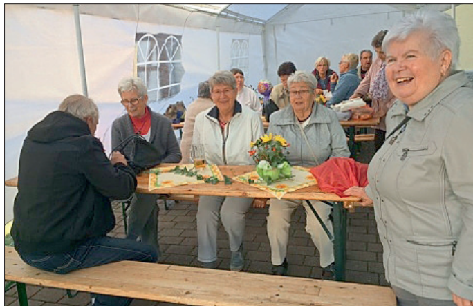
Das Cafézelt wurde sehr gut angenommen.