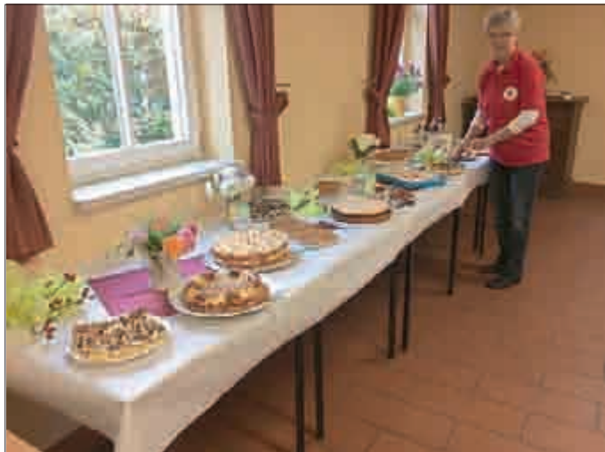
Die Landfrauen von Großgotttern hatten fleißig gebacken.