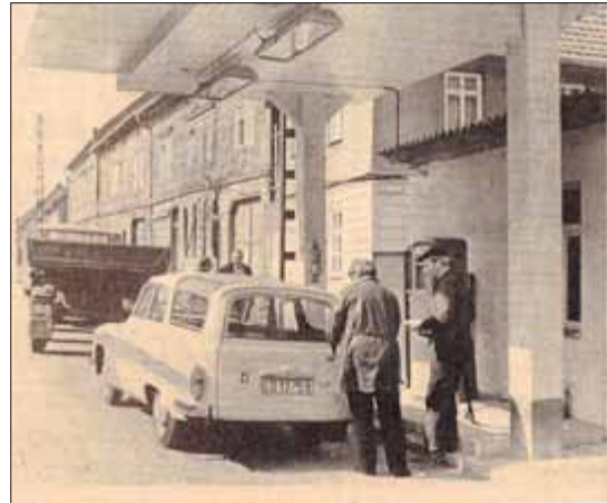
März 1973 Zur Freude der Krautfahrer, vor allem im Gemeindeverband, ist die Tankstelle in Großengottern wieder geöffnet. Tankwart Günter Jonas beim Betanken eines Wartburg Kombi.