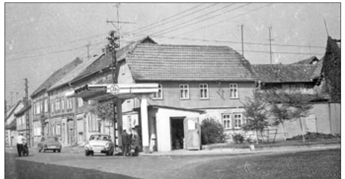
Marktstraße, VEB Minol Tankstelle mit Tankwart Günter Jonas Ein Skoda MB 1000 und ein Trabant 601 sind zu sehen.