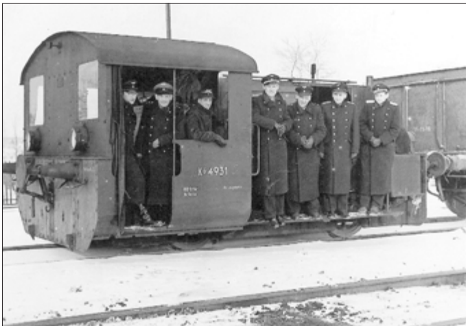
Februar 1956 Bahnhof Langensalza. Auf der Rangierlok haben sich Eisenbahner zum Gruppenbild aufgestellt, 5. von links ist August Wagner aus Großengottern.