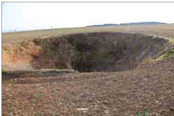
Erdfall bei Reichenbach