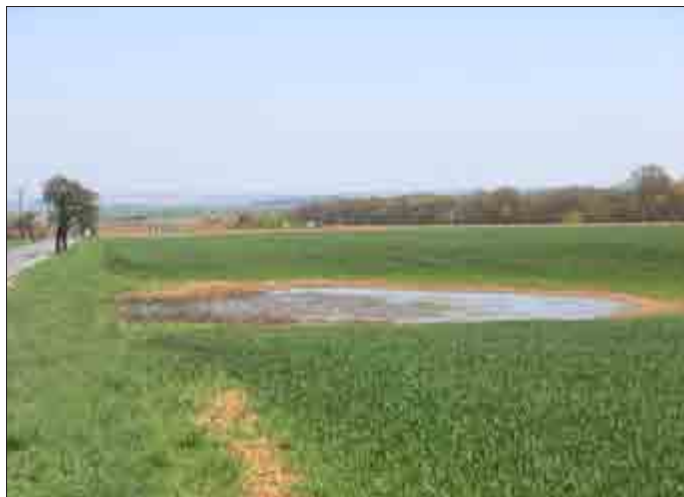
Bildet sich hier ein neuer Erdfall hinter Alterstedt