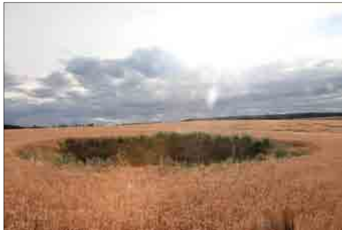
Erdfall bei Reichenbach

Es ist die geologische Charakteristik des östlichen Abhanges unseres Nationalpark Hainich durch Jahrtausende alte Auswaschungen im Mineral riesige Hohlräume zu haben. Der verkalkte Wasserkocher ist letztlich hiervon ein Resultat. Mächtige Einbrüche, die plötzlich entstehenden Erdfälle, zeugen als unausbleibliche Folge ob dieser ständigen Bewegung. Füllen sie sich im Tal mit Wasser, so Storchenteich bei Mülverstedt, Kainsprung oder Popperöder Quelle, bleiben alle Trichter am oberen Waldrand trocken. Die Natur holt sich die Senken dort mit Baumbewuchs zurück. Noch ursprünglich „nackt“ kann der Wanderer nördlich der Straße Reichenbach-Craula erst einen vor wenigen Jahren entstandenen Erdfall bewundern. Selbst Absperrpfosten sind schon in die Tiefe abgerutscht. Hier bereits in gefährlicher Straßennähe, bildet sich gerade am Straßen- und Waldrand vor dem Lindig, dem Thiemsburger Gehölz aus Richtung Alterstedt kommend ein weiterer Erdfall. Diese Senke, nach Regen mit Wasser gefüllt, zieht das Gefälle gefährlich bis in den Straßenbereich. Steht hier ein weiterer gewaltiger großer Erdenbruch bevor? Eine Abklärung der Tiefenstruktur des Bodens wäre dringend notwendig!