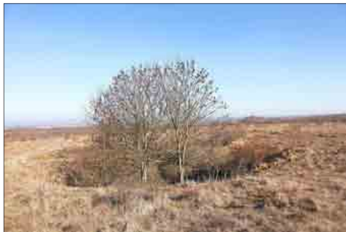
Erdfall vor dem Siechenholz