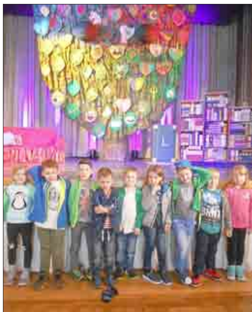
Die Schulanfänger und das Team der „Hainich-Wichtel“ aus Weberstedt

Das Ypsilon ging zurück in das Lexikon und das Alphabet war gerettet. Wir möchten es auch an dieser Stelle nicht versäumen, uns bei den Eltern, die uns zu den Veranstaltungen gefahren haben, zu bedanken.