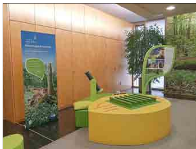
Mehrere Themeninseln laden zum Verweilen ein.