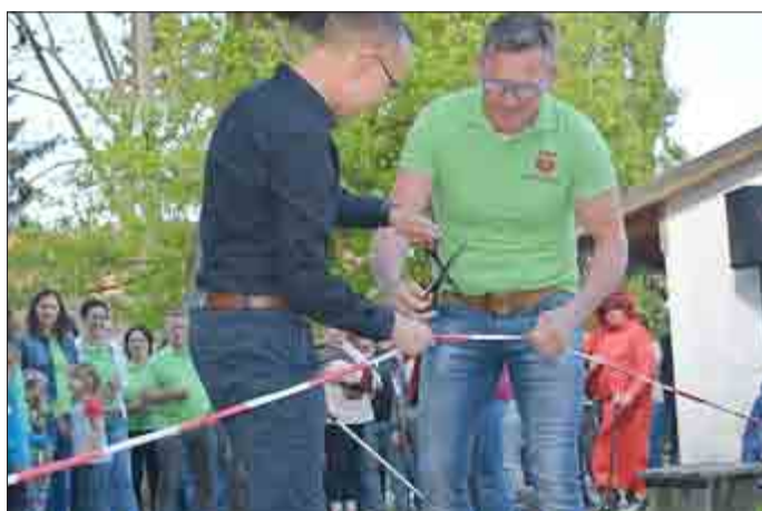
Dorfclub Weberstedt e.V.

Bereits in dieser Woche sind weitere Veranstaltungen, die den Fokus auf die Entwicklung des Nationalparks Hainich, vom ehemaligen Truppenübungsplatz zum heutigen Schutzgebiet als Bestandteil des Welterbes lenken, geplant.