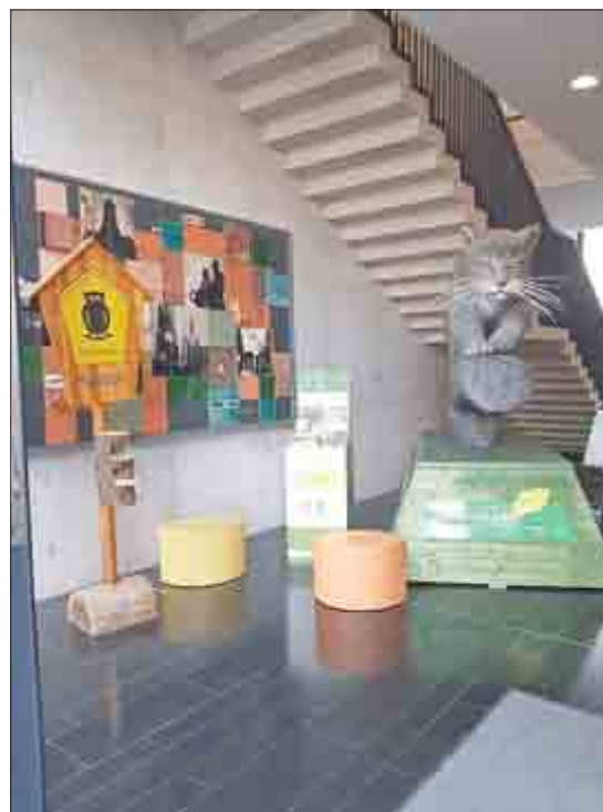
Im Foyer der Thüringer Landesvertretung in Berlin begrüßt seit vergangener Woche die Wildkatze aus dem Nationalpark Hainich die Gäste.