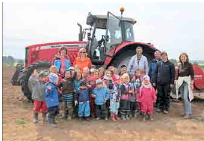
Die Kinder und Mitarbeiter der THEPRA „Rasselbande“ Seebach

Schnell konnte man die „alten Hasen“ unter den Kindern und Erzieherinnen ausmachen. Einigen Großen war das Projekt der vergangenen Jahre nämlich gut in Erinnerung geblieben und so konnten sie den Jüngeren wahrlich Hilfe leisten, kommende Vorgänge prima erklären und die Vorfreude auf die nächsten Besuche am Feld bis hin zur Kartoffelernte in ihnen wecken.