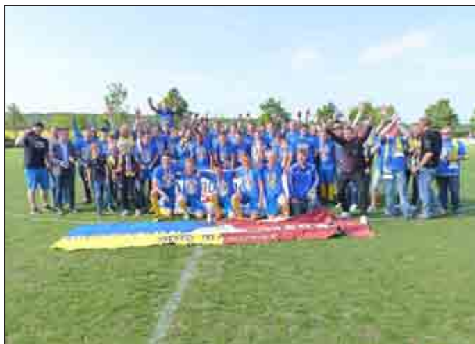
Pokalsieger mit Fans

Zu unserem 100-jährigen Vereinsjubiläum ist es endlich wieder gelungen, 8 Mannschaften für das Freizeitturnier zu gewinnen. In der Staffel A setzten sich souverän „Dynamo Dresden“ und die „Hoeg-Piraten“ durch. In der Staffel B ging es spannender zu. Sensationell scheiterten die Vorjahressieger „Gottersche Jungs“ bereits in der Vorrunde. Hier erreichten die „Baumgardts“ und die „Legenden“ die Halbfinalrunde. Am Ende ging der glückliche Gesamtsieg an die „Legenden“. In einem spannenden Pokalfinale konnten sie die „Hoegpiraten“ mit 1:0 bezwingen. Den 3. Platz belegten die „Baumgardts“ ebenfalls durch ein knappes 1:0 gegen „Dynamo Dresden“.