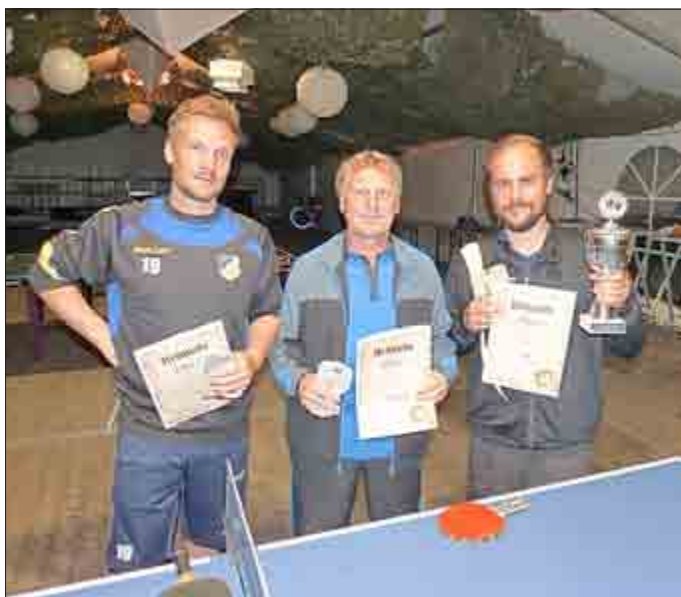
Die drei Bestplatzierten beim Tischtennisturnier

Die meisten Kinder mussten an diesem Tag auf ihre Papas verzichten. Sie waren mit einem Fan-Bus zum Kreispokalfinale unserer I. Mannschaft in Hüpstedt.