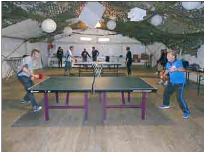
Tischtennisturnier im Festzelt

Am Dienstag fand das Tischtennisturnier im Festzelt statt. An vier Platten wurde erst eine Vorrunde gespielt, danach qualifizierten sich die besten für die K.O.-Runde.