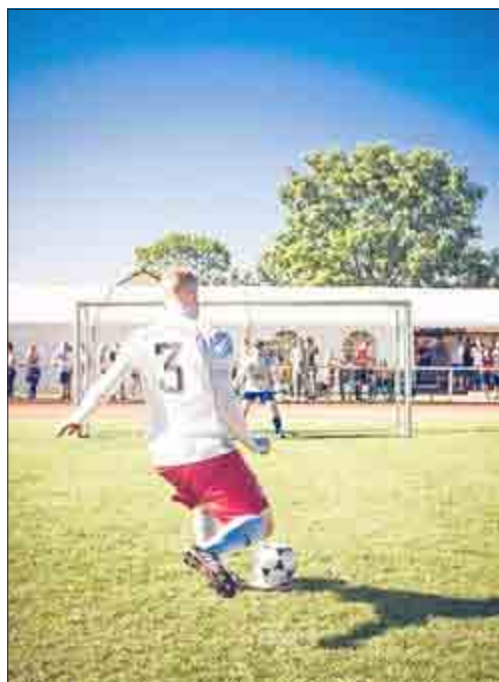
Stechen im Elfmeterschießen