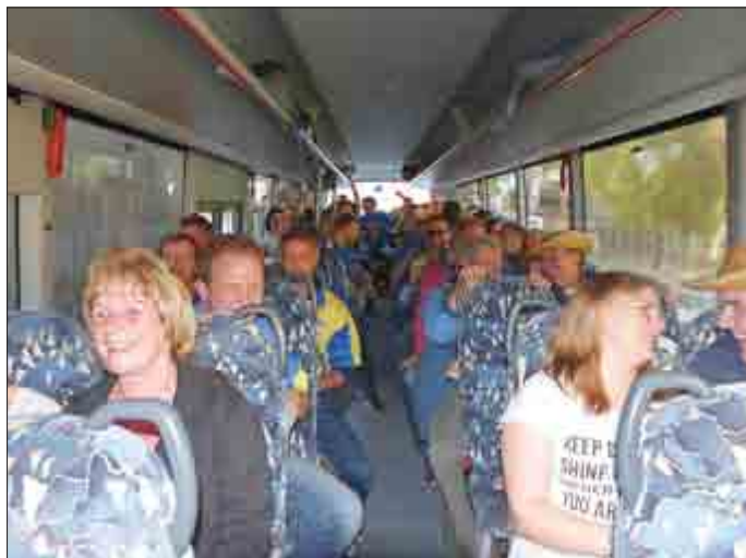
Eine tolle Idee, Anreise mit dem Fan-Bus zum Pokalfinale nach Hüpstedt

Nach über zwanzig Jahren wanderte der Kreispokal endlich wieder in die „Gurkenstadt“ Großengottern. Nach Anfangsschwierigkeiten wurde Marolterode mit einem letztendlich doch souveränen 5:0 Sieg von unserer I. Mannschaft bezwungen. Der Erfolg wurde anschließend im Festzelt gebührend gefeiert.