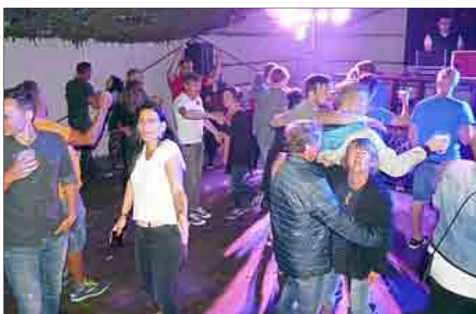
Ausgelassene Stimmung auf der Tanzfläche

Anschließend fand die große Abschlussparty im gut besuchten Festzelt mit DJ Nightfly statt.