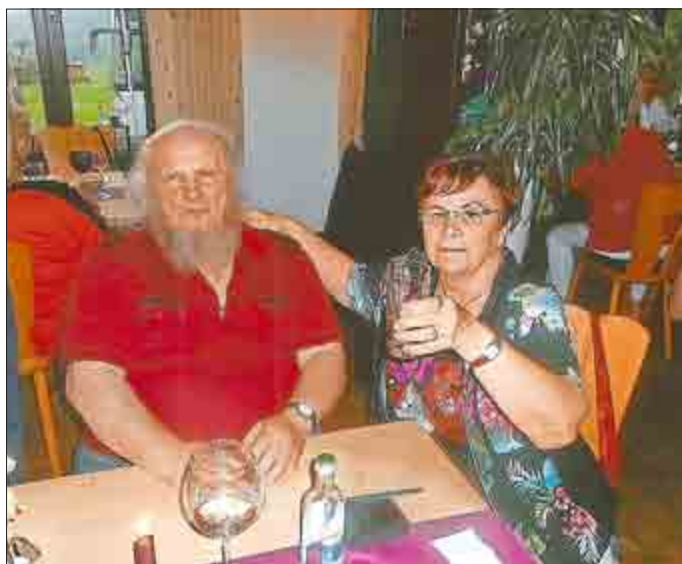
Text: Marlies Klippstein