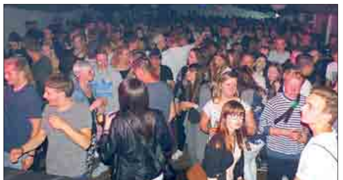
Super Stimmung bei „Kronisch Elektronisch“

Genau wie im letzten Jahr begann das große Zelt- und Sportfest des SC 1918 bereits eine Woche früher mit „Kronisch Elektronisch“. Unter dem Motto „Back to the roots“ traten die DJ's aus unserer Region auf, die für ausgelassene Partystimmung bis in die frühen Morgenstunden sorgten.