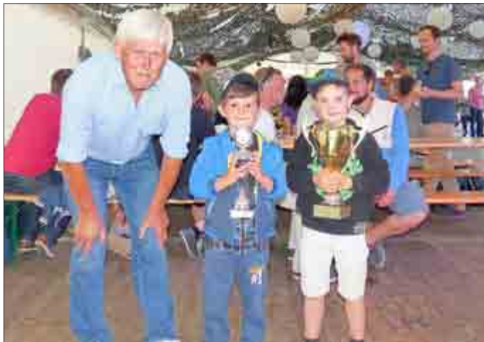
Turniersieger Opa Möhre, Torhüter der „Legenden“

Anschließend fand die große Abschlussparty im gut besuchten Festzelt mit DJ Nightfly statt.