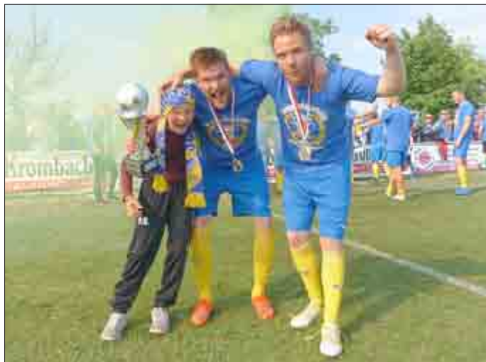
Da ist das Ding