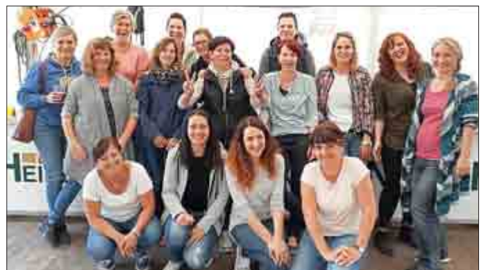
Die Muttis vom Kinderfest