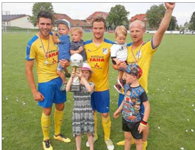
Pokalfinale in Bad Langensalza