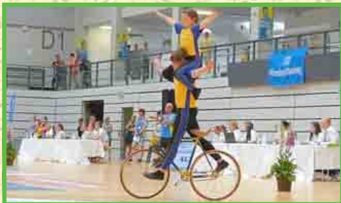
2er Kunstradsport Junioren