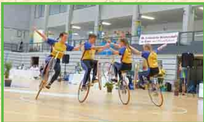
4er Kunstrad Junioren