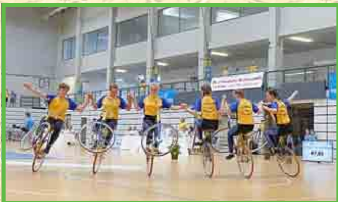
6er Kunstradsport Junioren