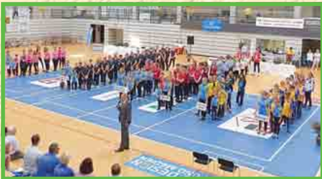
Eröffnungszereemonie, Einmarsch der einzelnen Bundesländer