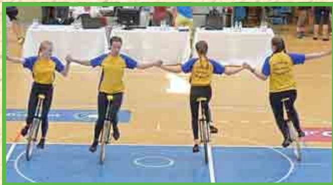
4er Einrad Juniorinnen