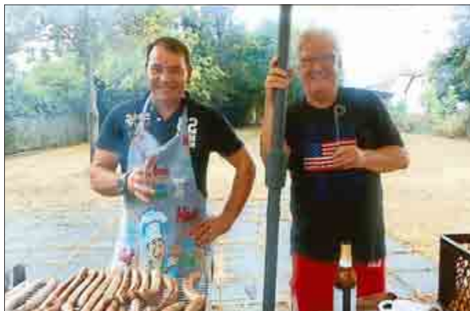
Text: Marlies Klippstein