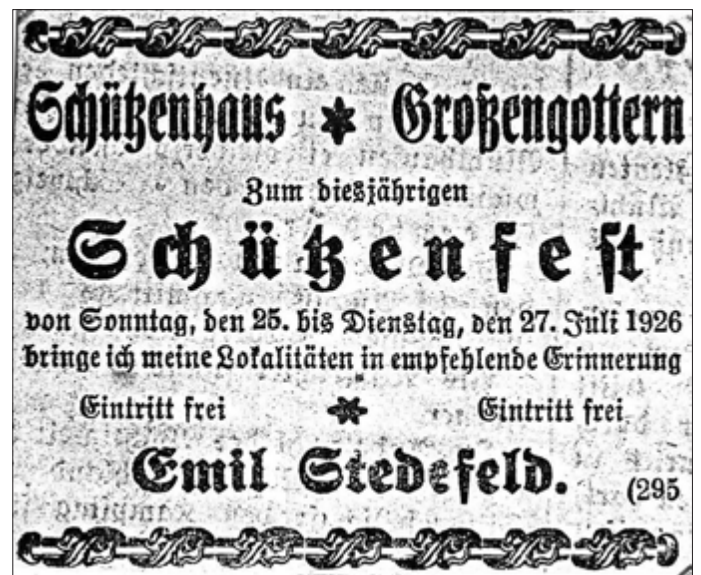
Anzeige im Langensalzaer Tageblatt 23. Juli 1926