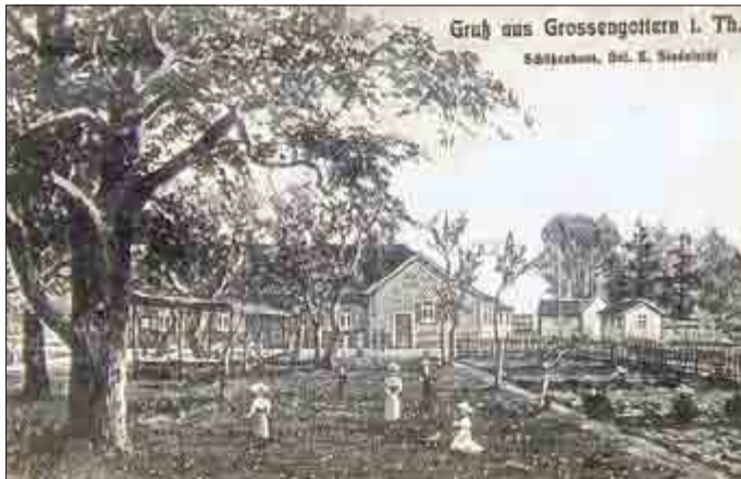
Der Schlossgarten in den 20er Jahren.