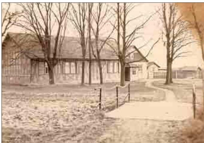
Die Brücke über den Suthbach im Schlossgarten in den 50er Jahren.