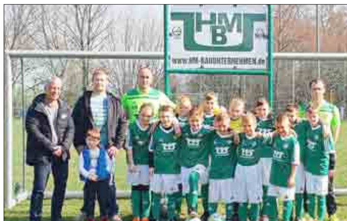
E-Junioren zur Heimpremiere 2019 in neuen Trikots der Firma HM-Bauunternehmen GmbH

Insgesamt also eine ordentliche Leistung auf die die junge Mannschaft aufbauen kann.