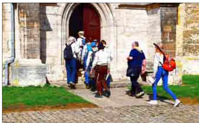
Pilger auf der Via Romea in Bad Langensalza, Bergkirche

Das Pilgern zwischen Thüringer Becken, dem Nationalpark Hainich und dem Eichsfeld kann ganz individuell gestaltet werden. Informationen zu Unterkünften und einzelnen Wegabschnitten erhalten Sie bei der Tourist Information Mühlhausen, Tel. 03601 404770, im Kloster Volkenroda Tel. 036025 5590 und im Kloster Hülfensberg, Tel. 036082 4550. Für den Bereich Bad Langensalza können Sie sich an das Evangelische Pfarramt Bad Langensalza, Tel. 03603 846402 oder 813304 wenden.