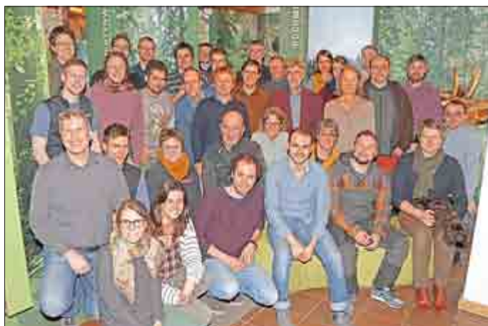
Zum Auftaktworkshop des Forschungsprojekts trafen sich Nationalparkvertreter und Forscher aus vier Ländern im Waldgeschichtlichen Museum in St. Oswald.

Auch in Nationalparks wird zumindest in Teilbereichen mittels Jagd regulatorisch in Wildbestände eingegriffen. Zum einen sind die deutschen Schutzgebiete in Anbetracht teils sehr großer Streifgebiete der Tiere oft zu klein, um dem Wild ganzjährig genügend Lebensraum zu bieten. Zum anderen können hohe Wildschäden in der umgebenden Kulturlandschaft, die Gefährdung des Schutzzwecks sowie das Risiko von Tierseuchen einen Eingriff in die Population nötig machen.