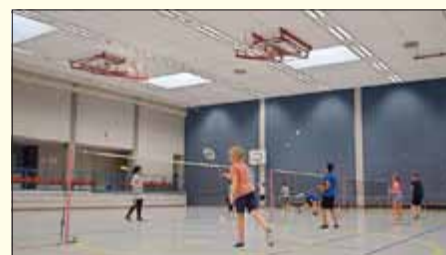
Alle Kinder waren mit großem Eifer und viel Freude dabei.