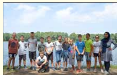
Gruppenbild am Stausee Großengottern

D. Lotze (Lehrerin am Jahngymnasium / Ver. für Öffentlichk.)