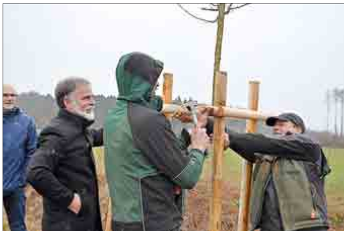
Die Mitarbeiter der Baumschulen Oberdorla pflanzen die ersten Jungbäume in der Vogtei.

Perspektivisch strebt der Landkreis an, dass wie auch mit dem Energiedienstleister geschehen, bereits in Vorbereitung und bei der Durchführung von Investitionen im Rahmen des Genehmigungsverfahrens dazu umfangreiche Abstimmungen durchgeführt werden, um verwaltungsseitig ein Angebot für Investoren zu schaffen, Ausgleichsmaßnahmen zielgerichtet und langfristig zu planen und diese schrittweise umzusetzen. Als Teil der Initiative „Herzlich grün – Lebensvielfalt zwischen Unstrut und Hainich“, welche kürzlich von Landrat Harald Zanker ins Leben gerufen wurde, tragen auch diese Prozessoptimierungen zum „grüner werden“ des Unstrut-Hainich-Kreises bei.