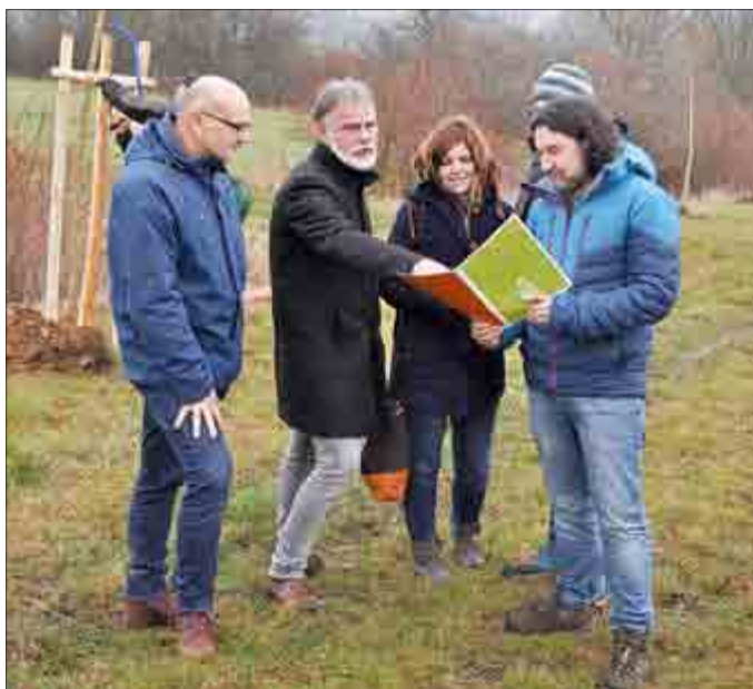
Die beteiligten Akteure besprechen die nächsten Schritte der auf die nächsten 4 Jahre angelegten Ausgleichs- und Ersatzmaßnahmen.