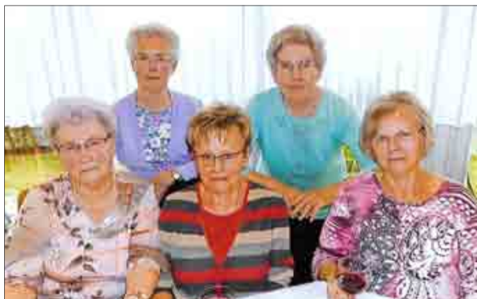
Text und Fotos: Christine Niedling