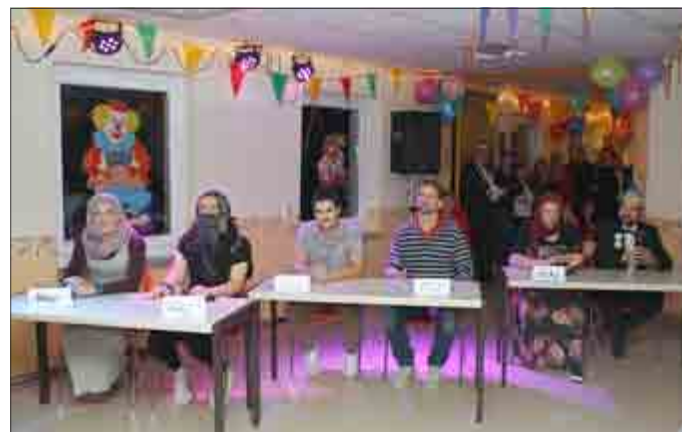
Die „Laichenden Hechte“