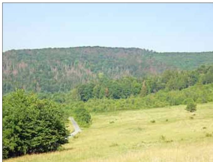
Der Klimawandel hat den Bäumen in steileren Lagen des Nationalparks stark zugesetzt, hier der Burgberg auf der Westseite des Nationalparks am 26.06.2019.

Im Rahmen ihres Forschungsauftrages wird die Nationalparkverwaltung 2020 versuchen, den aktuellen Zustand der Waldbestände und die weitere Entwicklung möglichst umfassend zu dokumentieren. Mit seinen zirka 30 vorkommenden heimischen Baumarten und dem Grundsatz „Natur Natur sein lassen“ ist der Hainich ein ideales Untersuchungsgebiet für die Frage, welche Laubbaumarten mit den neuen Gegebenheiten am besten zurechtkommen und wie die Natur mit dieser Entwicklung umgeht. Bereits Ende Mai 2020 steht der nächste Forschungs-Workshop an. Dann wird sich nach dem Laubaustrieb zeigen, welche Spuren die beiden vergangenen Jahre in den Beständen hinterlassen haben. Auch in der Umweltbildung wird 2020 der Klimawandel noch mehr in den Fokus gerückt.