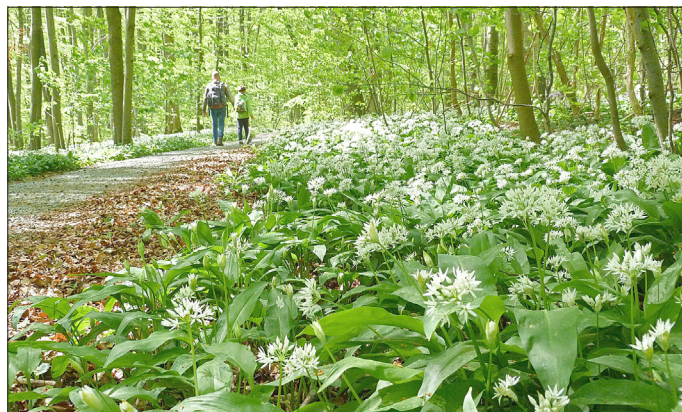
Solch wunderschöne Blütenteppiche zaubert der Bärlauch derzeit im Nationalpark Hainich auf den Waldboden.