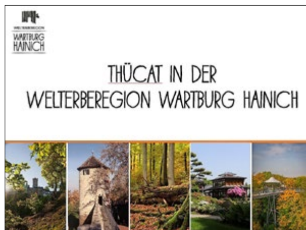
Vorstellung & Einführung der ThüCAT in der Welterbergregion Wartburg Hainich