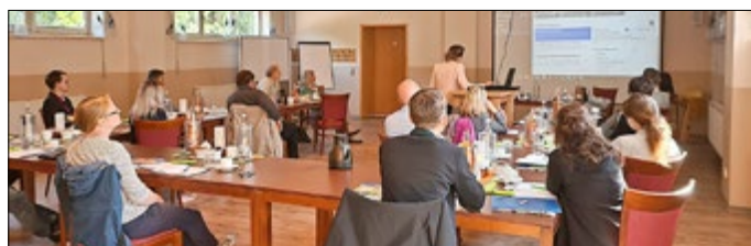
Veranstaltung zum ThüCAT-Start in der Welterbergregion

Als wichtiger Meilenstein in der Thüringer Tourismusstrategie wurde ThüCAT seit Anfang 2018 von der Thüringer Tourismus GmbH aufgebaut. Die Investitionskosten von 650.000 Euro für den Aufbau wurden aus Mitteln des Europäischen Fonds für regionale Entwicklung (EFRE) gezahlt. Die laufenden Kosten nach der Implementierung teilen sich künftig die TTG und die anerkannten großen Tourismusorganisationen.