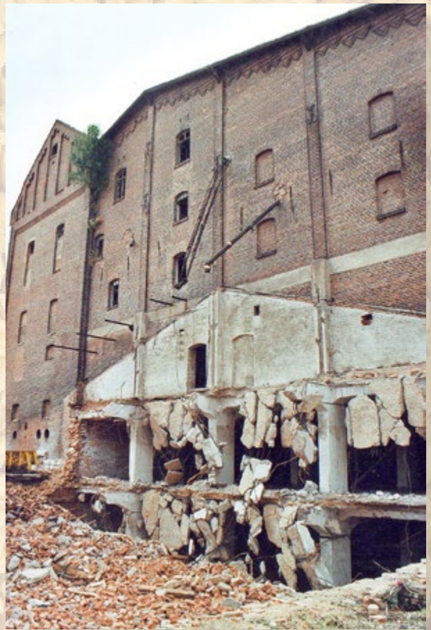
30.07.2007 Beginn der Abrissarbeiten am Gebäude