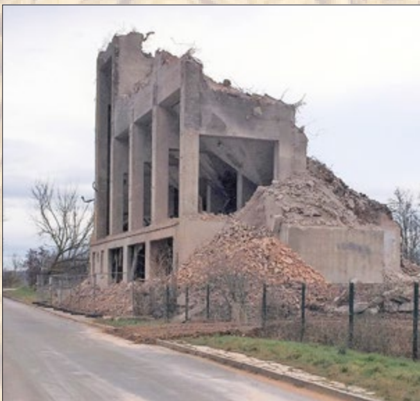
27.12.2020 Getreidesilo/Steinsilo (im Dorf als Malzsilos bekannt)