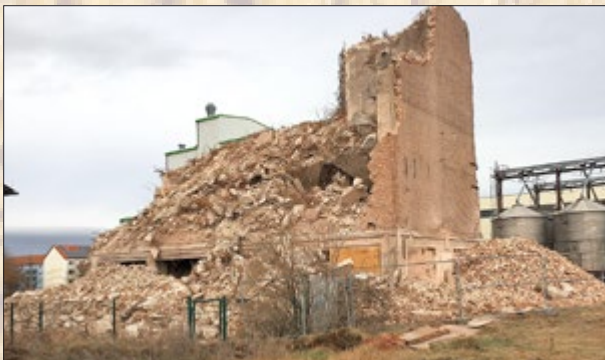
27.12.2020 Letzte Außenwand des Getreidesilos, aufgenommen von der Bahnseite