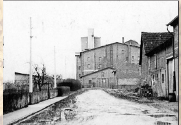
1968 Dr.-Wilhelm-Külz-Straße, Blick auf die Malzfabrik