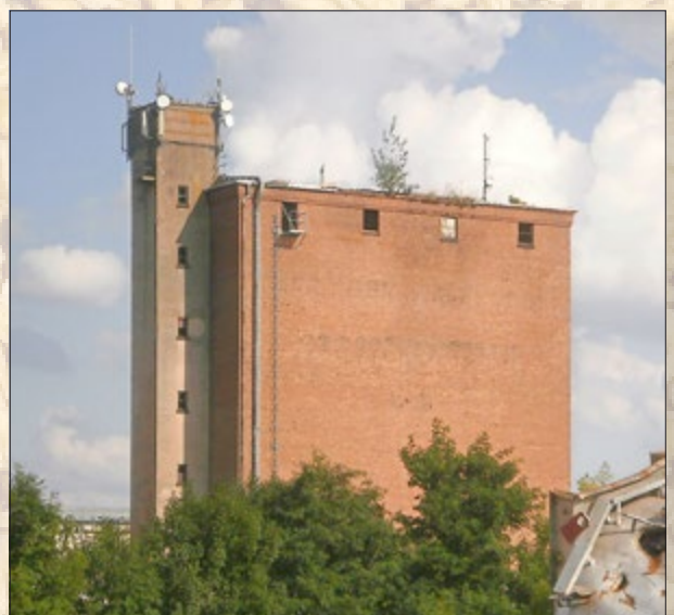
09.05.2010 Getreidesilo mit Turm blieb noch nach dem Abriss erhalten