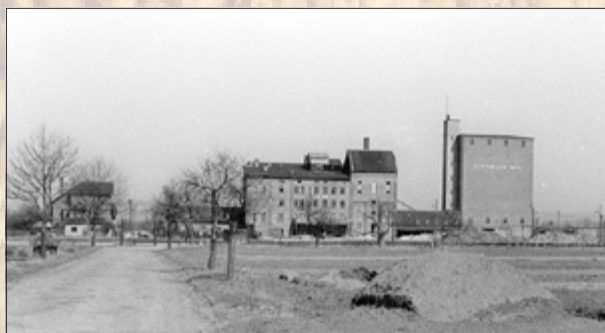
1955 Das „Wahrzeichen von Großengottern“