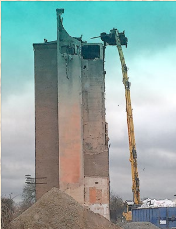
07.12.2020 Beginn der Abrissarbeiten des Malzsilos mit Turm