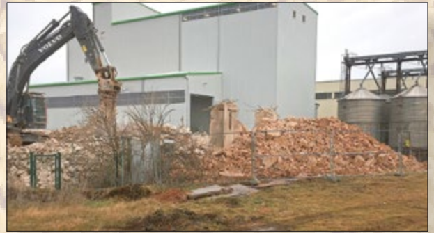
13.01.2021 Letzter Rest der Außenmauer