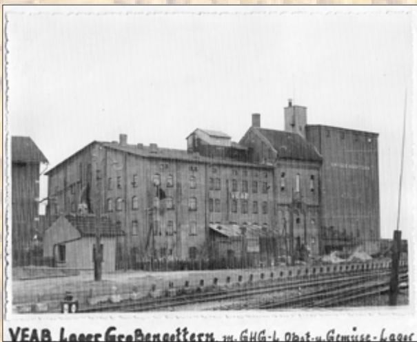
1950 Volkseigener Erfassungs- und Aufkaufbetrieb