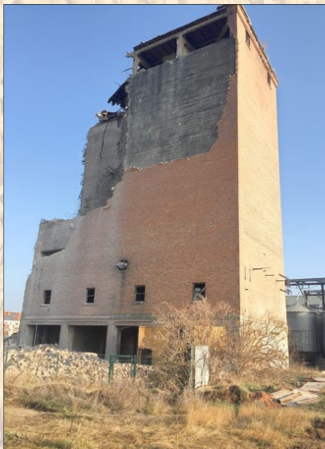
08.12.2020 Abriss des Malzsilos

Der Bau des Malzsilos (ehemaliges Getreidesilo) besteht aus einem Betonguss, dieser wurde mit einem halben Stein ummauert.