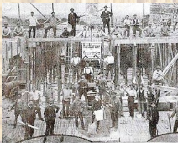
1909 Baubeginn der Thüringer Malzfabrik AG

1908 wurde die Mälzerei gegründet. Großaktionär war die Dortmunder Unions-Brauerei. Malz ist ein Produkt, das entsteht, wenn spezielle Getreidesorten (meist Braugerste) durch Einweichen zur Keimung gebracht werden (Mälzung). Diese Keimung wird durch schonendes Trocknen (Keimung) wieder unterbrochen. Nach dem Entfernen des Keimlings ist das fertige Malz lagerfähig und kann für die Weiterverwendung geschrotet oder vermahlen werden. Die bekannteste Verwendung des Malzes ist die zum Bierbrauen.