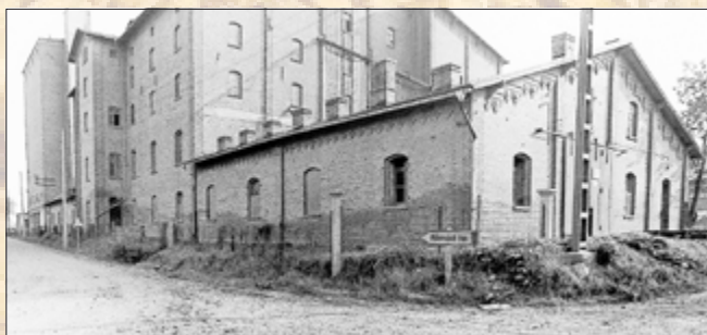
Foto 70er Jahre Malzfabrik-VEAB

Weithin sichtbar war bis in die 50er Jahre am Malzsilo mit Turm, dem späteren Getreidesilo, in großen Metallbuchstaben zu lesen Thüringer Malzfabrik A.G. Grossengottern . Die Schrift wurde später entfernt und darüber dann in weißer Farbe GROSSENGOTTERN angebracht. In den 70er Jahren wurde die Schrift erneuert VEAB GROSSENGOTTERN war zu lesen