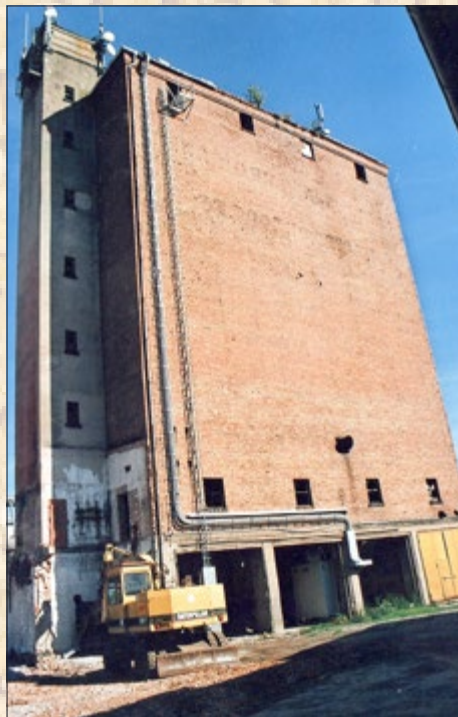
2007 Malzsilo mit Turm, die Schriftzüge sind nicht mehr lesbar.

Weithin sichtbar war bis in die 50er Jahre am Malzsilo mit Turm, dem späteren Getreidesilo, in großen Metallbuchstaben zu lesen Thüringer Malzfabrik A.G. Grossengottern . Die Schrift wurde später entfernt und darüber dann in weißer Farbe GROSSENGOTTERN angebracht. In den 70er Jahren wurde die Schrift erneuert VEAB GROSSENGOTTERN war zu lesen