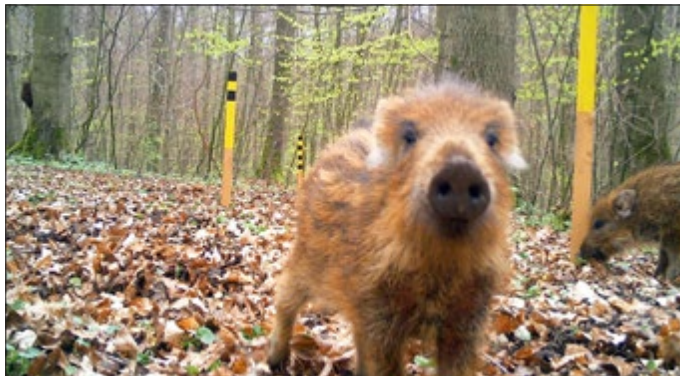
Von der Fotofalle erwischt: Wildschweine im Nationalpark Hainich

Aufgrund der aktuellen Lage um COVID-19 können die Ergebnisse leider nicht im Rahmen einer Präsenzveranstaltung vorgestellt werden. Aus diesem Grund wurden mit Unterstützung verschiedener Projektmitarbeiter/innen Fachvorträge zu den Themen Raumnutzung und Bestandsschätzung der Wildschweine im Nationalpark und Umfeld aufgenommen, die ab sofort auf der Vimeo-Seite des Nationalparks online zur Verfügung stehen.