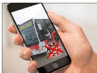
Grafik: Webmaster/ Landratsamt UHK

Sogenannte Ozongeneratoren werden zum Schutz vor der Ausbreitung von SARS-CoV-2-Viren in Fahrzeuge der Regionalbus GmbH eingebaut. Momentan ist die Ausstattung von bisher 49 Bussen geplant, wobei acht Fahrzeuge bereits aufgerüstet und fünf im Montagestatus sind. Priorität haben dabei die Regionallinien, die vorrangig zur Schülerbeförderung eingesetzt werden.