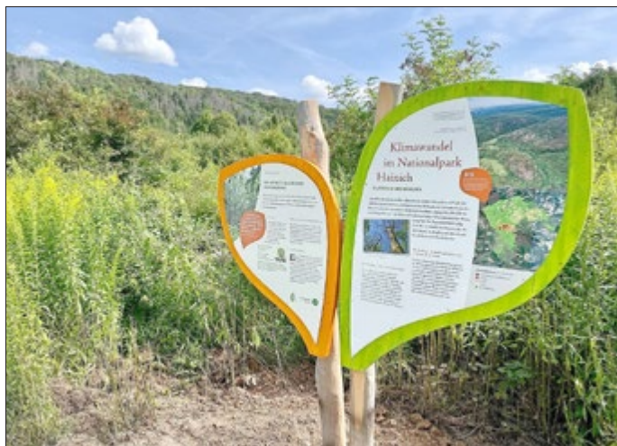
Tafel zum Klimawandel im Nationalpark Hainich, im Hintergrund der Burgberg mit abgestorbenen Bäumen

Abgestorbene Fichtenwälder im Thüringer Wald und im Harz sind leider schon gewohnter Anblick. Die Fichte ist auf vielen Flächen eine nicht standortgerechte Baumart, die eine gute Wasserversorgung benötigt. Die Trockenheit in tieferen Lagen macht ihr schwer zu schaffen. Die Rotbuche hingegen ist charakteristisch für den Naturwald Mitteleuropas. Als Ende Mai 2019 selbst im Nationalpark Hainich deutlich wurde, dass auch Rotbuchen vertrocknen und absterben, war das ein ganz neues Phänomen. Insgesamt sind auf rund 300 Hektar Buchenwald insbesondere auf den südwestexponierten und besonders flachgründigen Standorten zahlreiche Bäume abgestorben. Drei große Informationstafeln erklären nun am Sulzriedenweg den Klimawandel und seine Folgen.