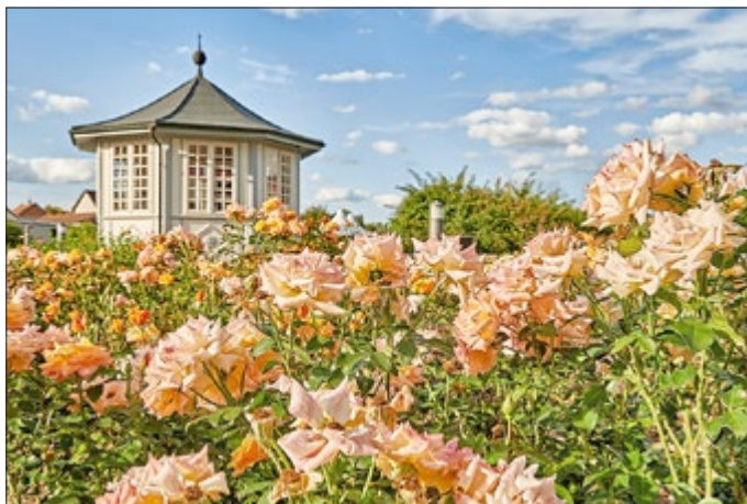
Rosengarten in der Kur- und Rosenstadt Bad Langensalza

Alle vier Produkte stehen für ein nachhaltiges und qualitativ hochwertiges Angebot, verfügen über ausreichende und vor allem mehrsprachige Informationen für Gäste, erfüllen Punkte im Bereich der Barrierefreiheit und wissen dies zu vermarkten. Kurz um bieten sie alles, was der Gast zur Vorab-Information benötigt und können die Erwartungen auch vor Ort erfüllen.