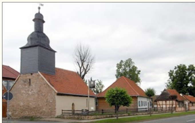
Das restauriertes Ensemble des SPITTELS, es fehlt leider die historische „Zigeunerlinde“

Ausgewählt und bearbeitet PJK, Erfurt/ Gotterscher Gemeindehistoriker