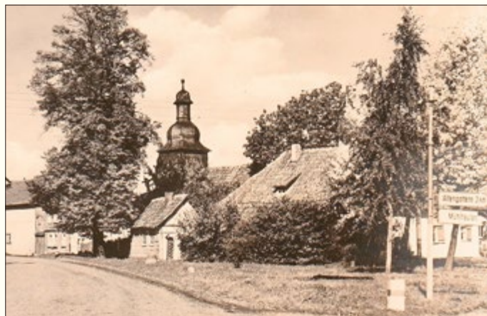
Das Ensemble des Spittels vor 1971 mit der alles überragenden historischen Spittel-Linde.