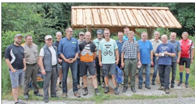
Gruppenbild der Veranstaltungsteilnehmer