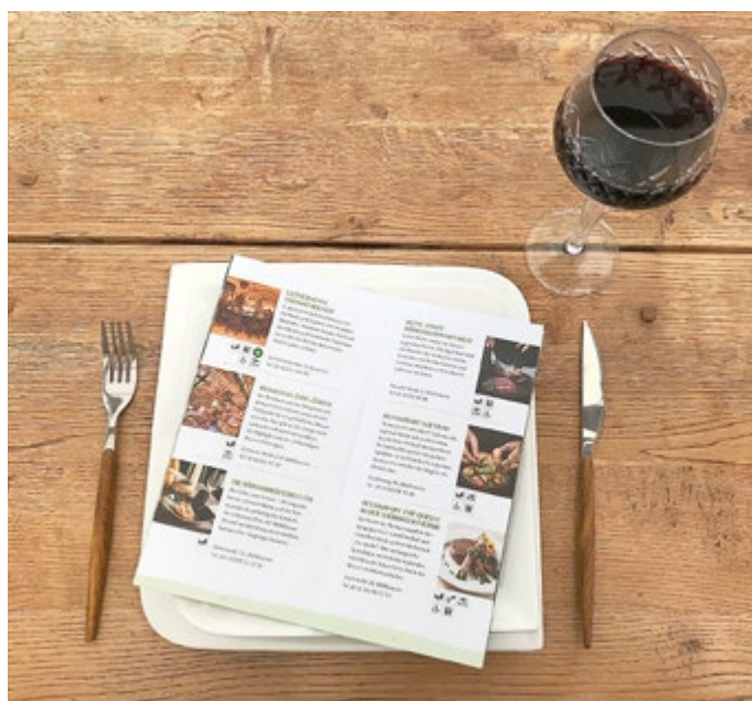
Neuer Genuss-Führer der Welterberregion Wartburg Hainich