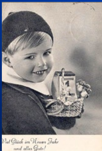
Viel Glück im Neuen Jahr und alles Gute! 1940