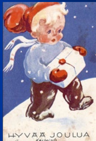
1943 Feldpost Lapland/Finnland