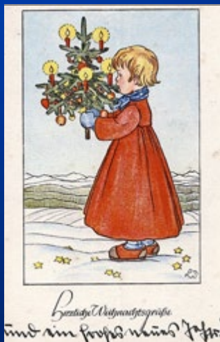
Herzliche Weihnachtsgrüße und ein frohes neues Jahr! 1941