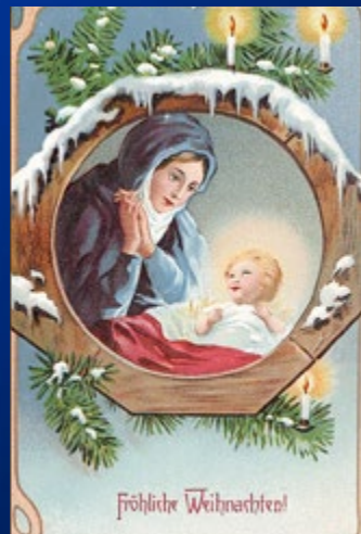
Frohliche Weihnachten! 1915 Feldpost