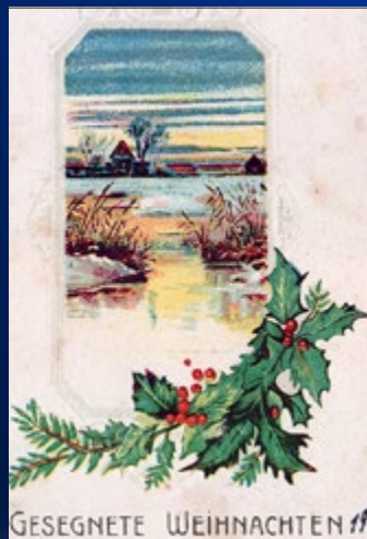
GESEGNETE WEIHNACHTEN !! 1917 Feldpost