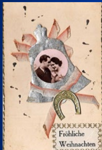
1942 Feldpost Frankreich