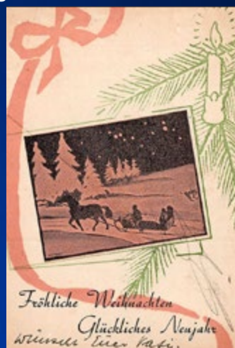
1943 Feldpost Lapland/Finnland