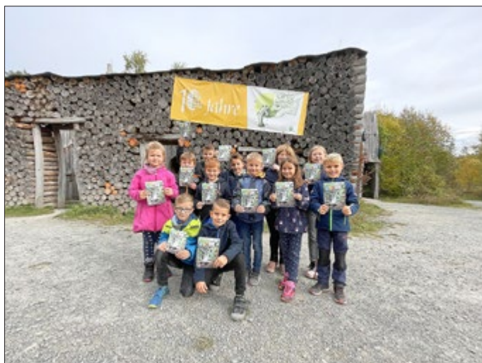
Unsere Patenwaldschulen, hier Schülerinnen und Schüler der Grundschule Berka vor dem Hainich, erhielten das neue Malheft als Allererste.