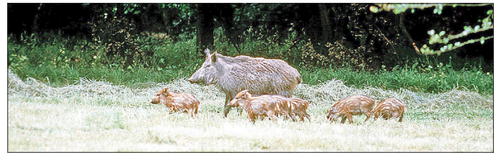
Der starke Anstieg des Wildschwein-Bestandes ist in nahezu ganz Deutschland bzw. sogar Europa festzustellen.