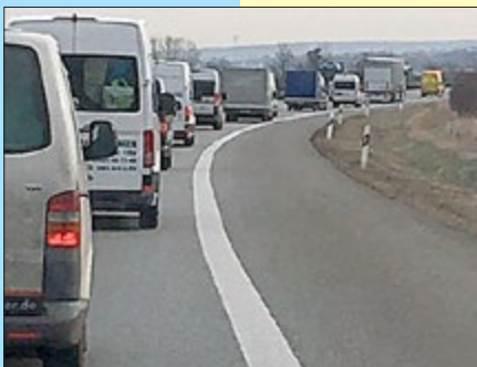
Konvoi nach Warschau.