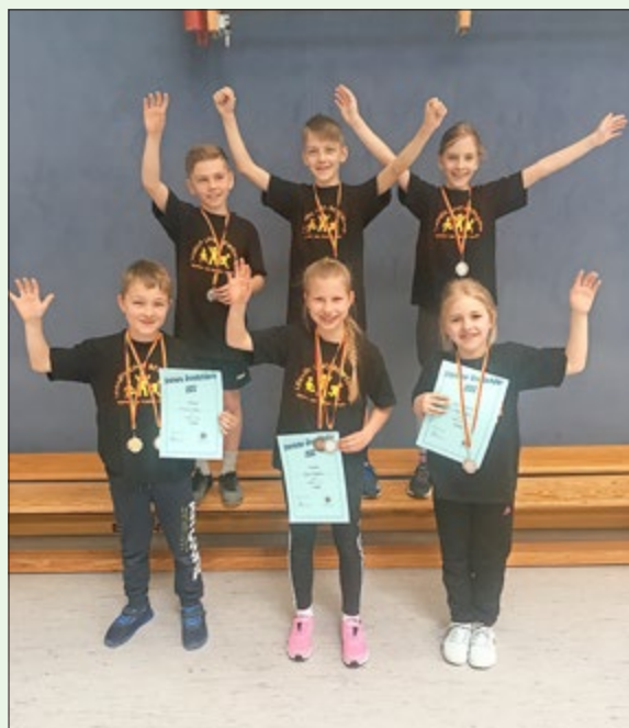
Die Freude war groß: Alle konnten mit einer Medaille die Heimreise antreten.