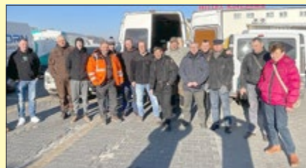
Gruppenbild in Korczowa: Ukrainische und thüringische Helfer*innen gemeinsam.

te medizinische Produkte und Hygieneartikel sowie Lebensmittel enthalten. Am Mittwoch, den 9. März, wurden die Spenden in Kartons gepackt und in Mühlhausen von ukrainischen Helfern entsprechend beschriftet. Am Freitag, den 11. März, um 15 Uhr startete die Tour nach Korczowa, ein Dorf im Südosten Polens nahe der Grenze zur Ukraine gelegen. Auch dieser Transport wurde im Vorfeld abgestimmt, um eine gezielte Verteilung der thüringischen Spenden zu ermöglichen. So erreichten an diesem Tag auch ca. 700 Luchtpakete aus dem Unstrut-Hainich-Kreis die ukrainische Grenze. Jan Brückner und Unterstützer fuhren binnen 11 Tagen über 4000 km.