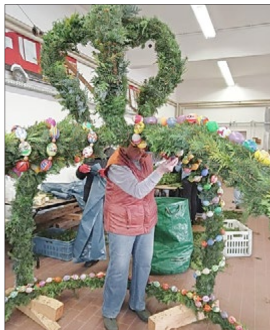
So langsam nimmt die Osterkrone Form an.