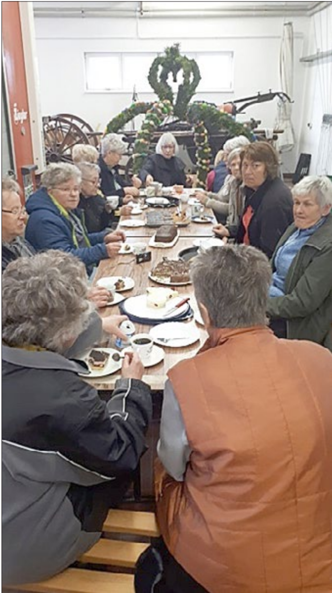
Nach getaner Arbeit schmeckt der selbstgebackene Kuchen doppelt so gut.