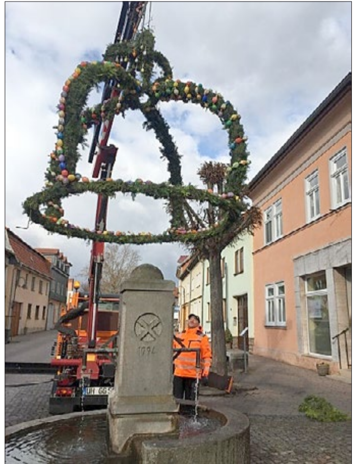
Mit geübten Griffen lässt er die Osterkrone auf den Brunnen herab.