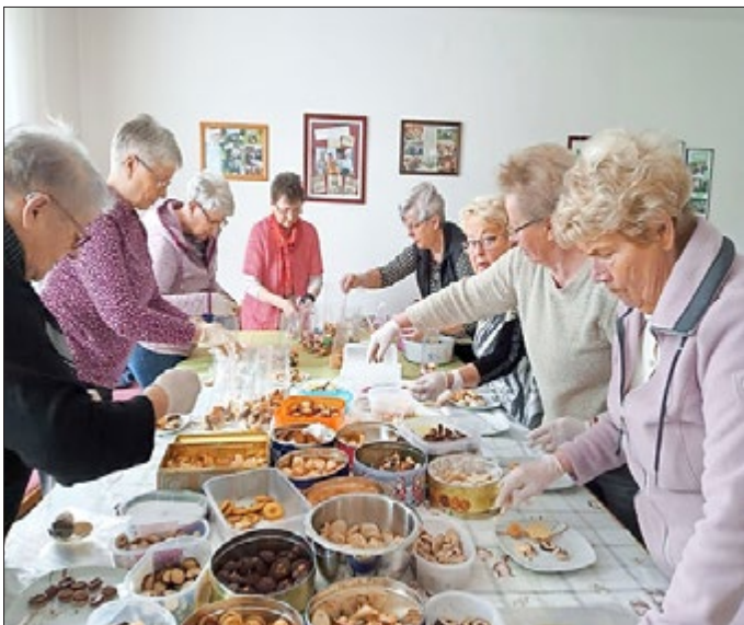
Die Landfrauen haben fleißig Osterplätzchen gebacken.