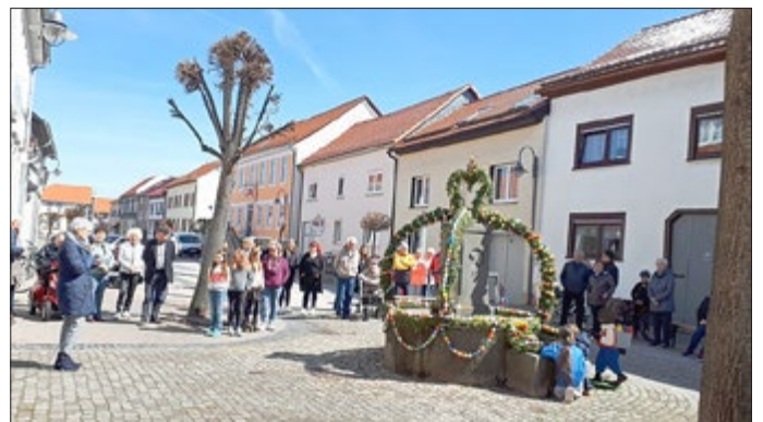
Mit einer kurzen Ansprache eröffnet Landfrau Thea Laaß die Osterkroneneinweihung.