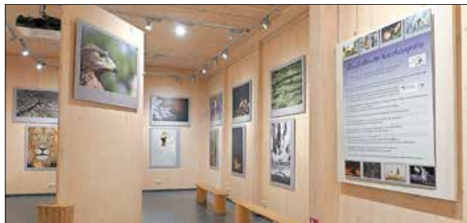
Die Sonderausstellung „20 Jahre Glanzlichter“ ist im Nationalparkzentrum zu sehen.