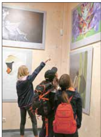
Eine 4. Klasse aus der Grundschule Berka/Werra bewundern die Siegerbilder.

Ab sofort sind im Nationalparkzentrum an der Thiemsburg die 52 Siegerbilder des Internationalen Naturfotowettbewerbes „Glanzlichter“ aus den Jahren 1998 - 2008 zu sehen. Zu zeigen, wie wunderschön, faszinierend und schützenswert unsere Natur ist, gelingt diesem Wettbewerb und den einprägsamen Gewinnerbildern seit vielen Jahren. Diese Glanzlichter-Sonderausstellung beinhaltet alle All Over-Winner, dazu die Tiger's Best-Sieger, Junior Award-Winner und Fritz Pölking Award-Sieger aus 20 Jahren Glanzlichter-Jahrgängen, mit Ausstellungs Bildern auf bis zu 1,20 Meter Breite.