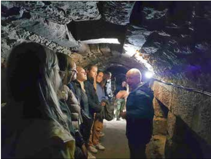
Besichtigung der Kasematten von Schloss Friedenstein

Weitere Fragen beantworten wir gerne unter: Welterberregion Wartburg Hainich e.V. OT Weberstedt Am Schloss 2 99991 Unstrut-Hainich Telefon: (03 60 22) 98 08 36 presse@welterbe-wartburg-hainich.de www.welterbe-wartburg-hainich.de