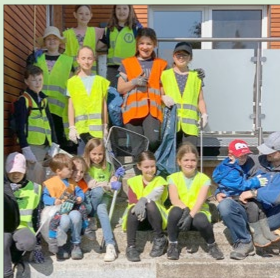
Team der Umwelt-Freunde-Hainich