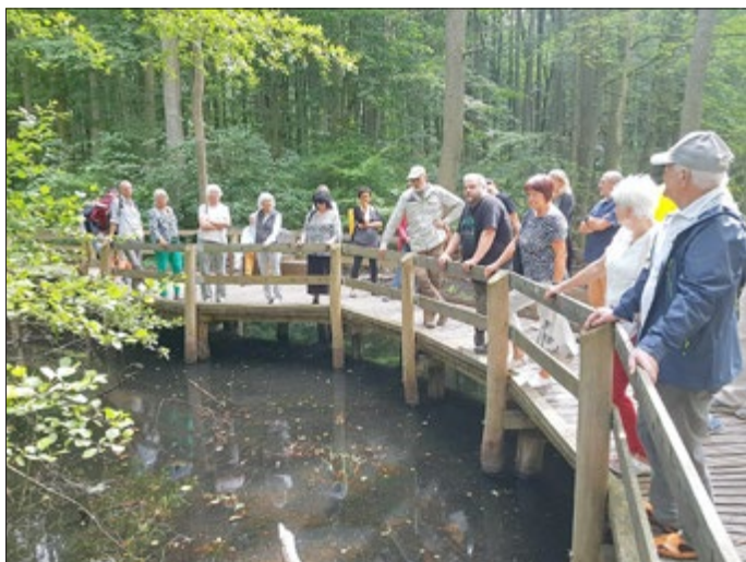
Teilnehmer:innen der Veranstaltung

Das Projekt wird gemeinsam mit dem Büro NeumannConsult aus Münster durchgeführt, die bereits bei verschiedenen anderen Projekten, wie der Erstellung der regionalen Tourismusstrategie, erfolgreich mit der Region zusammenarbeiten. Zusätzlich begleitet die Thüringer Tourismus GmbH den Prozess des Pilotprojekts, um eine mögliche Ausweitung des Projekts auf alle Thüringer Reiseregionen vorzubereiten.