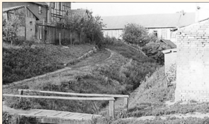
1940 Brücke Goldner Ring, links Haus Gebhardt, Suthbach, ganz rechts Turbinenhäuschen der Klippmühle

Beide Männer waren auf dem schmalen Fußweg am Bach Ziegelstraße (Familie Gebhardt) einer am anderen haltend im Dunkeln abgerutscht und gemeinsam in den Bach gefallen und hatten keinen Rückweg mehr gefunden. Es war wohl an der Mühle eine bequeme Treppe vorhanden. Diese hatten sie aber entgegengesetzt gesucht. Durch den Sturz und den Fall in das Wasser waren beide Männer tüchtig nass geworden. Zuvor waren sie noch angeheitert gewesen, doch waren beide jetzt vollkommen nüchtern geworden. Mit einem „Schönen Dank“ setzten sie ihren Heimweg Goldner Ring fort, wo ihren Ehefrauen sie längst erwarteten.