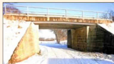
2010 Ziegelstraße Unterführung

Ergänzend zu meinem Beitrag Klippmühle Großengottern (Amtsblatt 25/2003):