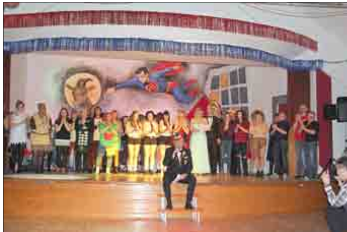
Auf eine schöne Kampagne ein dreifach donnernd schallendes St. Bock He-lau, He-lau, He-lau!