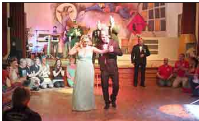
Tanz des Prinzenpaares

Freunde tanzten den Heroldshäuser Volkstanz und luden den Verein und die Gäste zum Mitmachen ein.