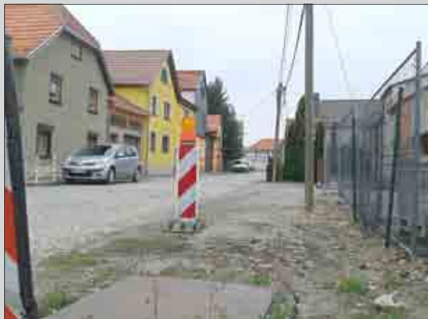
Die Kreuzstraße in Altengottern mit angrenzender Rosenstraße und Kleine Gasse werden in den nächsten drei Jahren komplett erneuert.

Wenn nun einerseits mit dem geplanten Straßenausbau ein lang gehegter Wunsch der Anwohner in Erfüllung geht, dürfte sich andererseits ein weiterer noch in diesem Jahr für die Einwohner der Unstrut-Gemeinde erfüllen. Wie der Bürgermeister weiter informierte, verhandelt er zurzeit mit einem Vertreter einer großen Lebensmittel- und Drogeriekette über die Eröffnung einer Verkaufsstelle im Ort. Seit der Schließung der Kaufhalle vor vielen Jahren war es bislang noch nicht gelungen, diese Lücke zu schließen.