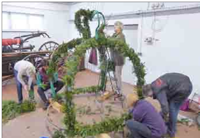
Landfrauen beim Binden der Osterkrone im Feuerwehrgerätehaus von Großengottern