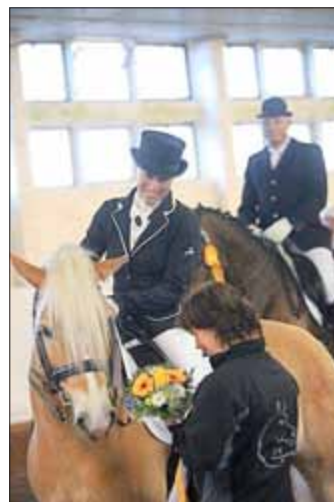
KM Dressur Anka Anhalt - Großengottern