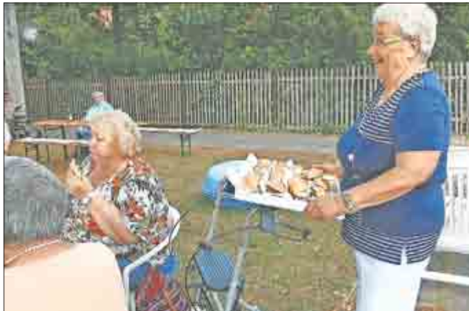
Zwischendurch wurden die begehrten Fischbrötchen serviert.