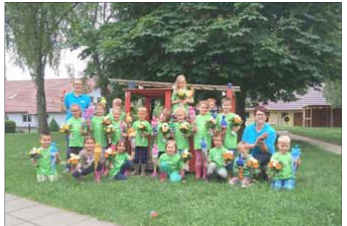
Freitagabend war es dann Zeit für das gemeinsame Abschlussfest. Nach dem Abendessen überraschten die ABC-Kinder ihre Eltern mit einem tollen Programm. Als Hexen und Gespenster feierten sie gemeinsam die Geisterstunde.