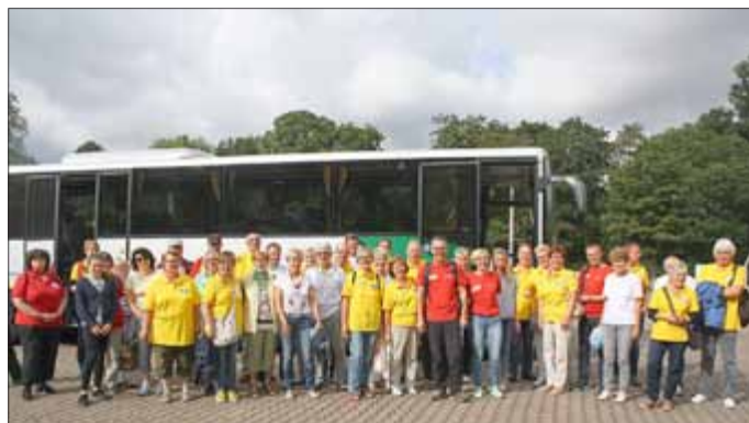
Nach dem Sieg sangen alle: „So ein Tag, so wunderschön wie heute ...“