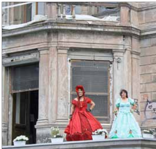
Spielrunde: historische Gewänder aus verschiedenen Epochen mussten zugeordnet werden ...