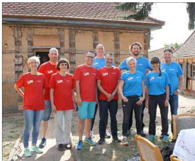
Team Großengottern & Team Nordhausen