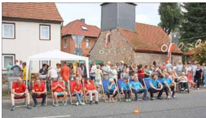
Juhu - Gewonnen! Und jetzt warten wir auf unsere Umgehungsstraße