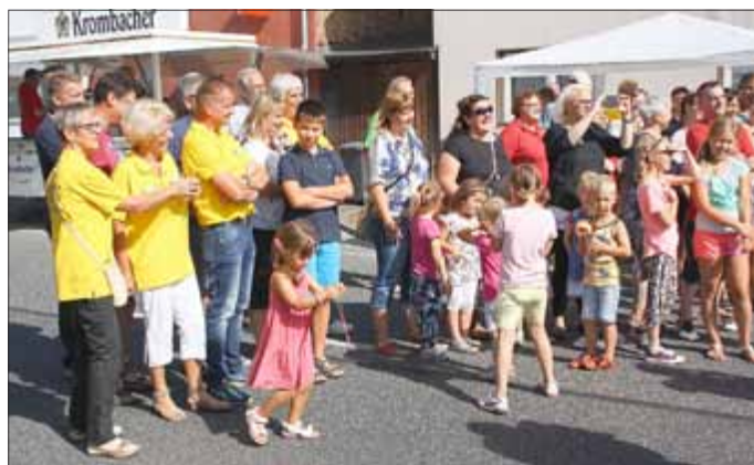
Volkfeststimmung um den „Spittel“