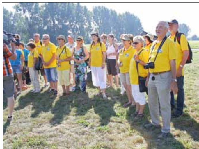
Gottersche Mitgereiste bei 40 Grad im Schatten ...