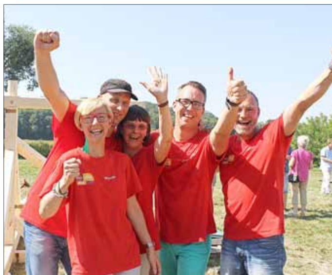
Wir sind die Sieger!!!