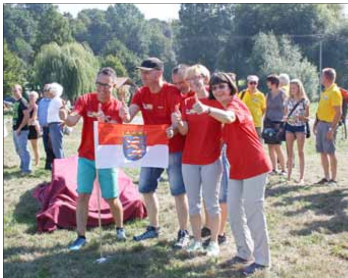
Team „Spittel“ ganz gespannt ...