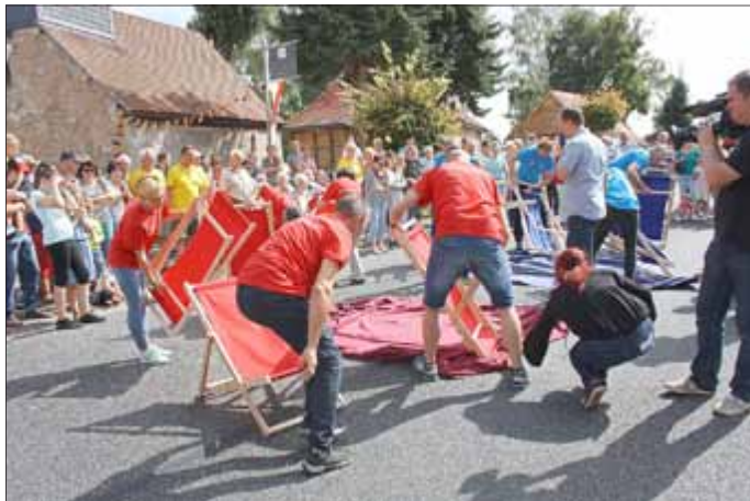
1. Spielrunde „Liegestühlen aufbauen“