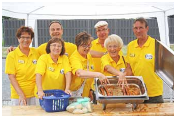
Die letzten Rostwürste ...