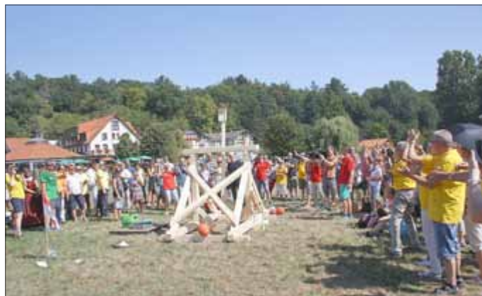
Steinschleuder funktioniert, gottseidank!!!