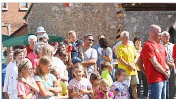
Gespannt wurden die Wettspiele von den Gotterschen verfolgt ...