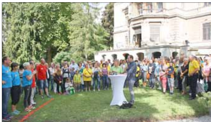
Park Hohenlohe mit den Moderatoren ...