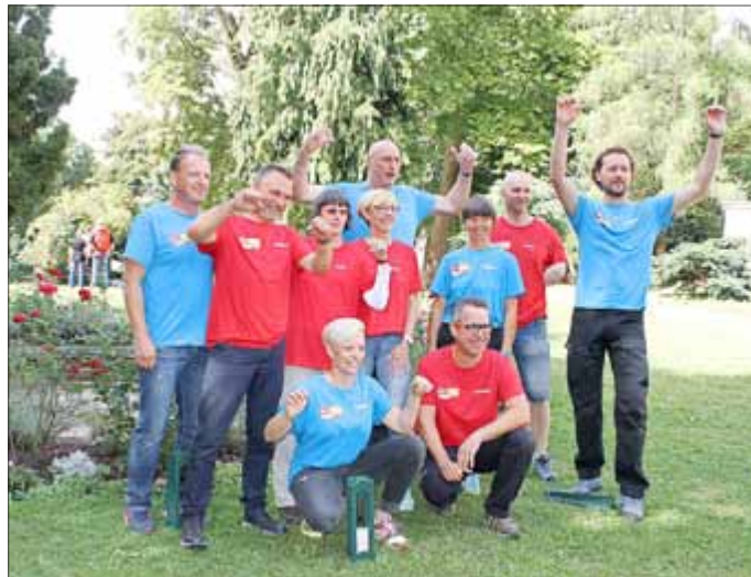
Das Nordhäuser Team wünschte uns viel Glück zur nächsten Runde in Höfgen ...

Als wir uns vor dem Bus versammelten, sangen alle „So ein Tag, so wunderschön wie heute ...“ und stießen mit Sekt auf unser tolles Team an.