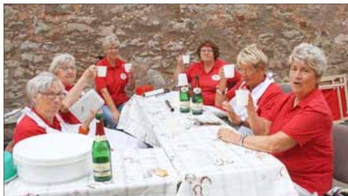
Die Landfrauen nach getaner Arbeit ...