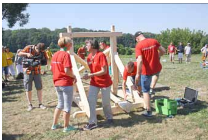
Endphase beim Zusammenbauen des Katapults ...