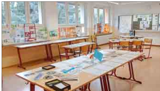
Geografieraum mit Quizz und Ausstellung von Schülerarbeiten insbesondere zum Thema Europa und EU