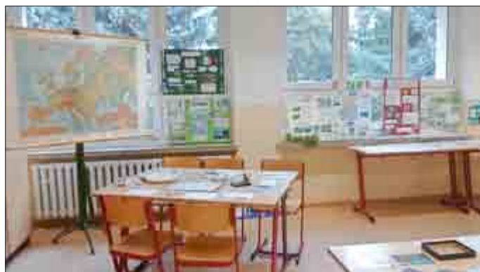
Spiele und kleine Rätsel erwarteten die zahlreichen Besucher und wurden gern ausprobiert ...