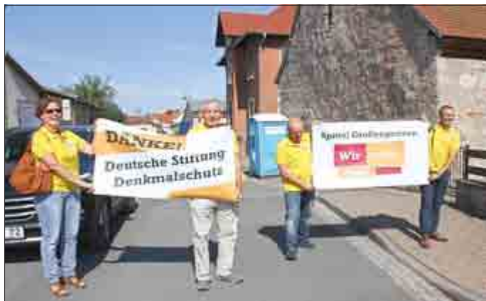
Plakate wurden mitgeführt, die zur Motivation beitragen.

Am 7. September war es endlich so weit. Das Finale der Show „Stefanie Hertel - Meine Stars“ fand in Zwickau statt. Das Team Leuben/Sachsen kämpfte gegen das Team „Spittel“ aus Großengottern.