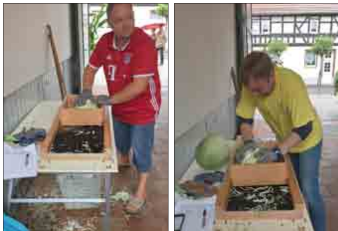
Text u. Fotos: Joachim Schweizer