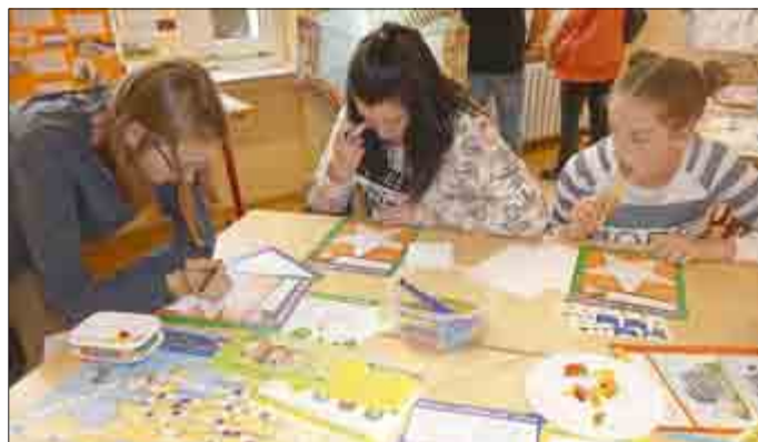
Besucher sahen im herbstlich geschmückten Geografieraum Schülerarbeiten von 5- und 6-Klässlern